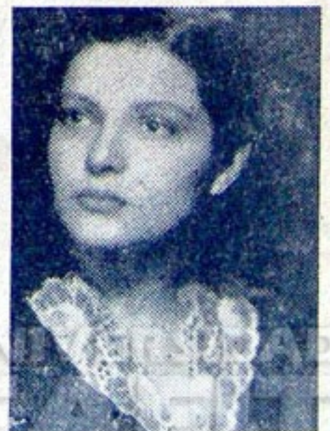
— Pola Negri.