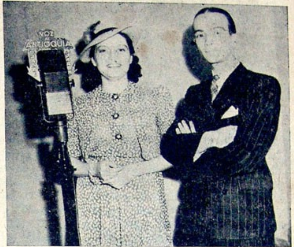
Greta Garbo —