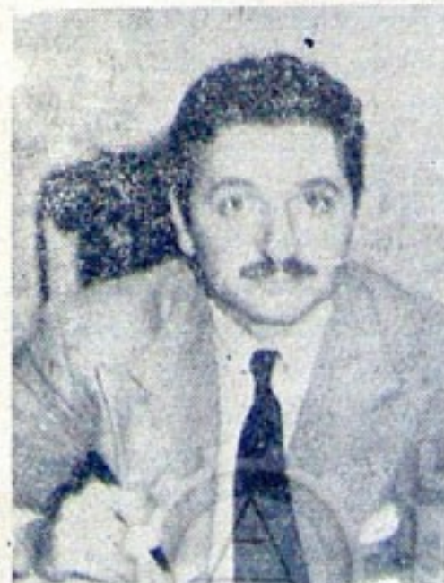
Edward G. Robinson. —