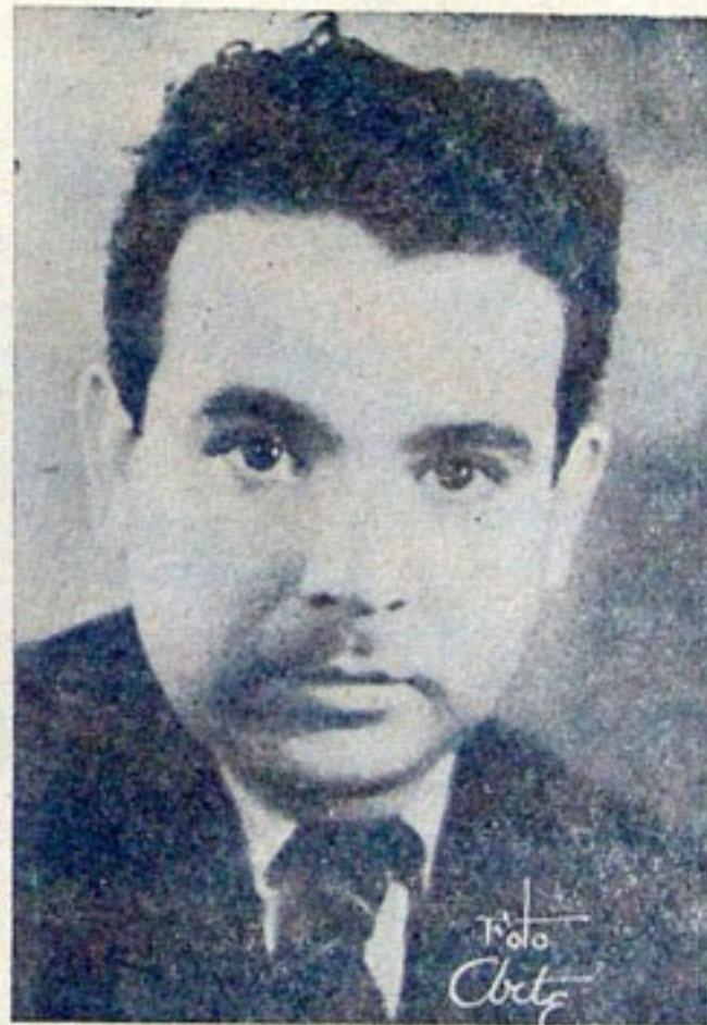
Edward Arnold —