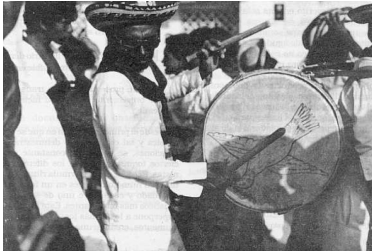
Imagen 1 Tamborero en festival de música de Tamalameque

compendio de datos sobre variaciones rítmicas y melódicas del ritmo de Tambora-tambora.