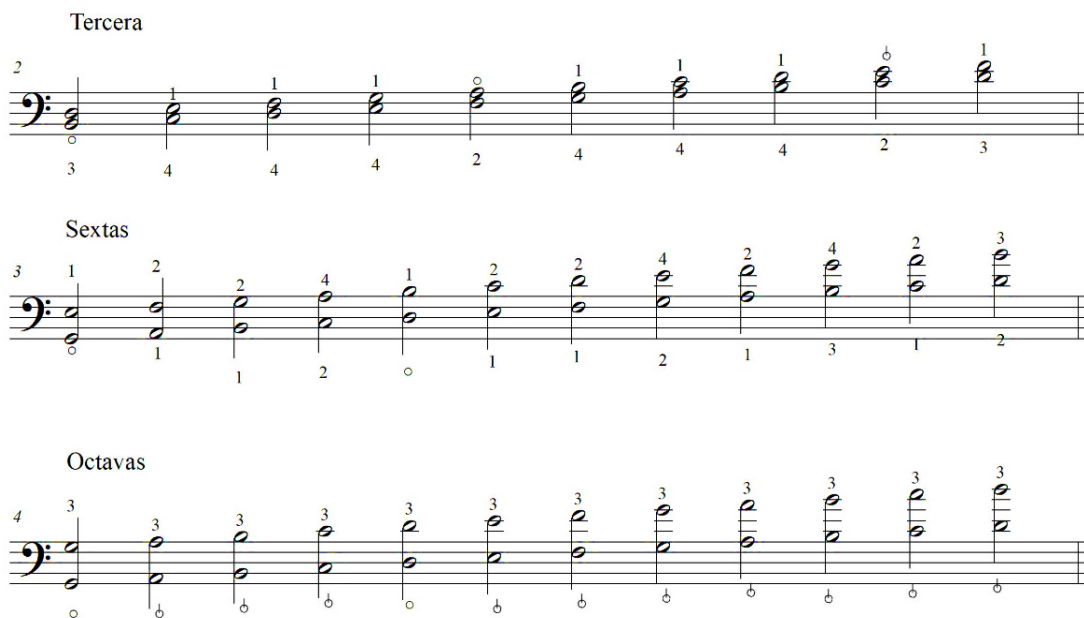
Imagen 14 Rango de tesituras para terceras, sextas y octavas

el tocar muchas notas alteradas podrían ser un reto que hay que replantear a nivel técnico si es realmente lo que se busca. Este aspecto antes mencionado aplica para el caso de las dobles cuerdas en terceras, sextas y octavas, como se muestra en la imagen 14.