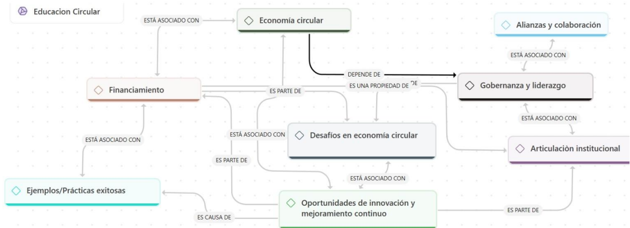
Figura 1. Relaciones conceptuales en economía circular