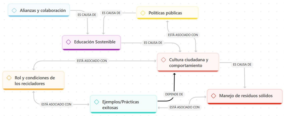
Figura 3. Relaciones conceptuales en Educación sobre economía circular.