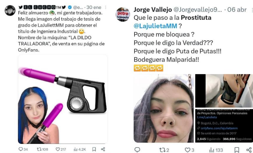
Imagen # 8 – Publicaciones que integran la funa contra ‘La Julieta’ en la red social X con tres meses de diferencia.

En ese sentido, podemos evidenciar cómo estos patrones en el escarnio público contra la creadora de contenido no solo están presentes en los comentarios de las publicaciones originales, sino que se replican y se mantienen durante el tiempo con nuevas publicaciones que obedecen a la misma narrativa. Lo que evidencia que a pesar de que la funa nace como una denuncia sustentada y argumentada por un contrato que ‘La Julieta’ obtuvo en la UNGRD, posteriormente es instrumentalizada por activistas y militantes de la oposición.