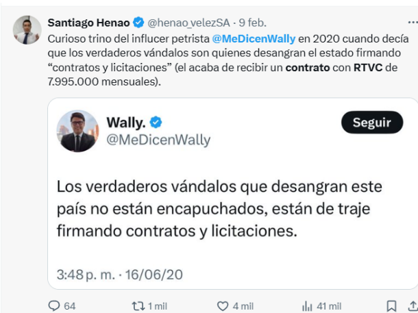
Imagen # 10 – denuncias en redes sociales con los contratos de los influencers ‘Wally’ y ‘Don izquierdo’.

¿Pero qué implicaciones negativas se pueden observar de estas funas políticas instrumentalizadas en el ejercicio democrático? Uno de los principales riesgos cuando una denuncia pública es implantada en la esfera pública digital y luego instrumentalizada hasta convertirse en funa es el desbordamiento de las acusaciones y el perfilamiento de individuos por su posición ideológica. Una práctica que sin control en las redes sociales puede llegar