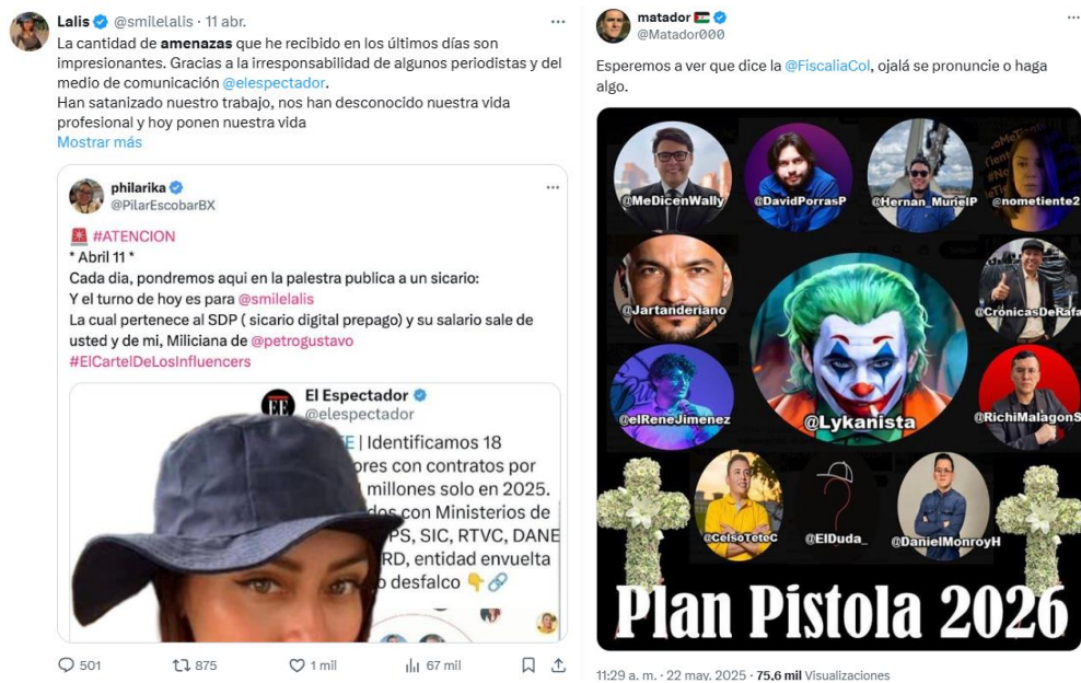
Imagen # 11 – amenazas y perfilamientos en contra de creadores de contenidos y opinadores.

hasta manifestaciones que van desde los insultos y las calumnias, hasta comportamientos con implicaciones delictivas como las amenazas.