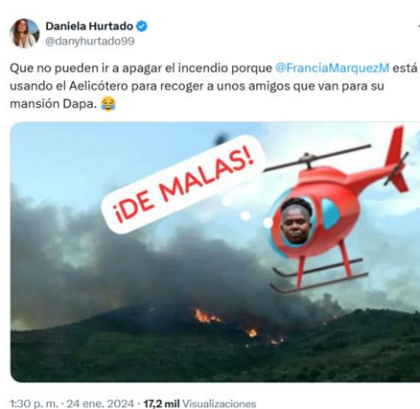
Imagen # 4 – Tuit de la