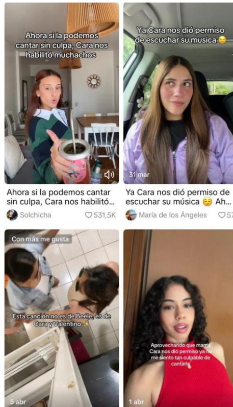
Imagen # 1 – Reacciones de los usuarios en Tiktok