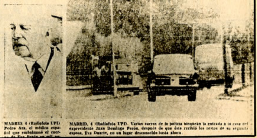
MADRID. 4 (Radiofona UPI). Pedro Ara, el médico español que embalsamó el cuerpo de Eva Duarte... MADRID. 4 (Radiofona UPI). Varios carros de la policía bloquean la entrada a la casa del expresidente Juan Domingo Perón, después de que éste recibió los restos de su segunda esposa, Eva Duarte, en su lugar desconocido hasta ahora.

-En lugar secreto será sepultado en España-