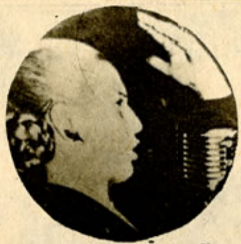
La Señora (y 6)