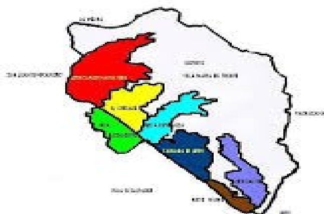
Gráfico 4.1.2: Villa María del Triunfo, zonas administrativas

Según el Centro de Estudios y Promoción del Desarrollo (DESCO): “Villa María del Triunfo presenta, paradójicamente, a la vez que serios niveles de pobreza, un significativo incremento de la pequeña y micro empresa, sector organizado en buena parte sobre la base de redes familiares o de parentesco, con un ritmo que rebasa la capacidad de su gestión local” (DESCO 2007). Otra característica importante referente al distrito de VMT que se menciona en dicha publicación es que