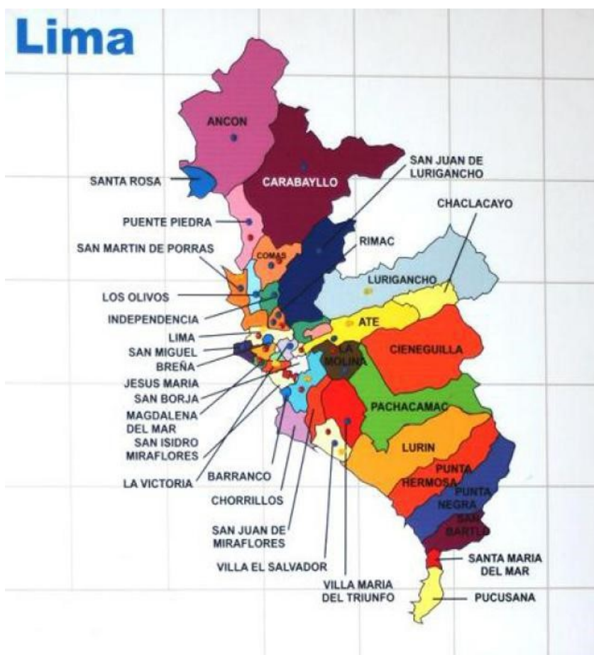
Gráfico 4.1.1: Villa María del Triunfo, ubicación en la región de Lima Metropolitana

El 28 de diciembre de 1961, mediante la Ley No.13796, se creó el distrito de Villa María del Triunfo, el cual surgió en los años 50 como un centro urbano. En la actualidad tiene un área de 70,57 Km 2 . Según cifras oficiales del INEI al 2013, el distrito contaba con una población de 433 861 habitantes, por lo que es el sexto distrito con mayor población a nivel departamental. Se encuentra ubicado al sudeste de la región de Lima Metropolitana con la cual se encuentra comunicada a través de diversas avenidas y con la presencia de un transporte público masivo de pasajeros. En el gráfico 4.1.1, se puede apreciar su delimitación y sus fronteras con los distritos de San Juan de Miraflores, La Molina, Pachacámac, Lurín y Villa El Salvador.