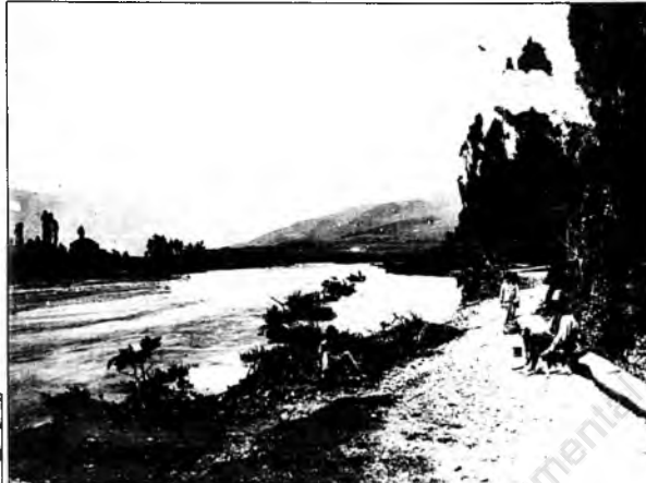
¡Adivina, adivinador! Ya no estaba Antonio, el negro esclavo, por ahí. Pero aún rondaba por el Valle del Aburrá el último tigre. Es el Río Medellín que supo de muchachos pescando y de balsas. En 1895.

«Entérense, señores y señoras! Medellín no es un pueblito cualquiera, sino una poderosa Villa. Sigue Toño con sus recuerdos... Y en el morro el tigre...»