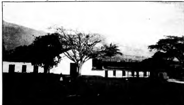
El Poblado El Poblado de San Lorenzo de Aburrá, para algunos historiadores el primer embrión de la ciudad de Medellín, nació como resguardo de indios. Sería El Poblado. Era su cara el último decenio del pasado Siglo. En presente, como a la señora de mantilla y vestido largo. Súbale altura a la Iglesia. Póngale bulla y carros -Foto de Melitón Rodríguez - Archivo de El Colombiano.