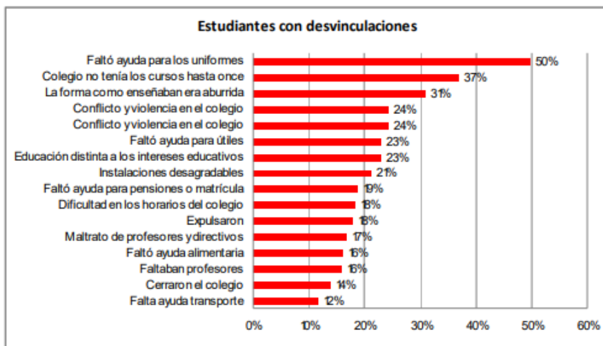
Ilustración 3. Condiciones de los Establecimientos Educativos en Antioquia.