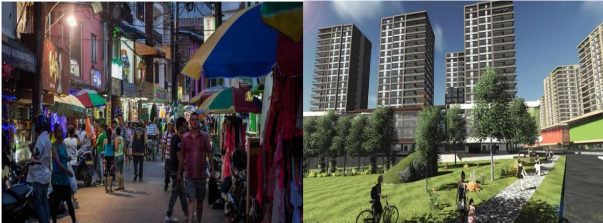
Imagen 7 y 8. A la izquierda: el tejido social, la vida en la calle, un modelo de economía con más de sesenta años de tradición. A la derecha: parte del render que se proyecta en el Plan Parcial Municipal.