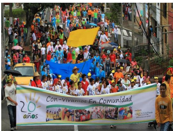
Imagen 3. La pancarta de la Corporación Con-Vivamos encabeza la Marcha Carnaval, al cierre del Foro Urbano Alternativo y Popular.

El Foro alternativo desarrolló dos mesas de trabajo y una de ellas tuvo como eje central el derecho a la ciudad. Alrededor de este eje resonaron las demandas —recurrentes— de políticas de vivienda digna para los sectores más desprotegidos y, por supuesto, dotación de servicios esenciales para estas comunidades. La gran conclusión del encuentro fue que se debía avanzar hacia la formación de sujetos políticos que asumieran de manera efectiva el derecho a transformar la ciudad, acorde con los intereses, la cultura y la identidad de sus habitantes.