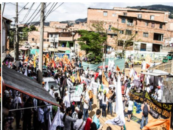
Imagen 4. Marcha Carnaval al cierre del Foro Urbano Alternativo y Popular.

Además su activa participación en el marco de ambos foros, organizaciones sociales de Medellín publicaron su propia declaración llamada “Declaración. Diálogos cruzando el campo y la ciudad en Medellín”. Como lo reivindica su consigna, estas organizaciones proponían un horizonte claro: “Por el derecho a la ciudad, la defensa de nuestros territorios y la vida digna” (2014). Ahora bien, el asunto no se restringió a meras declaraciones y consignas, sino que las organizaciones sociales, además de los programas que continuaron