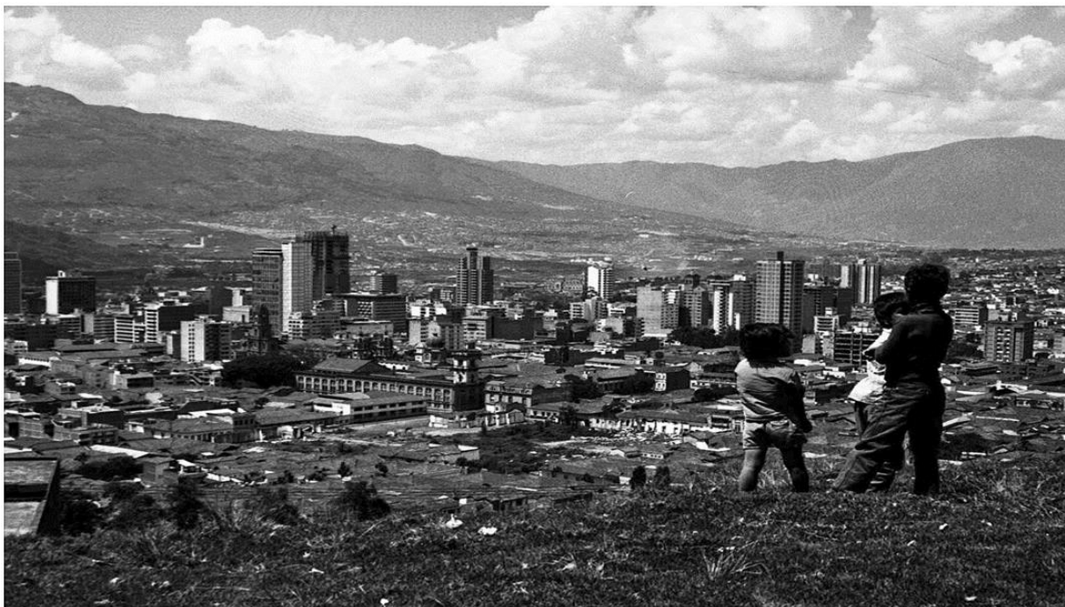
Imagen 1. “Panorámica de Medellín”. La fotografía evoca “la otra ciudad”.

empezar a percibir desde la década de los setenta, cuando los nuevos emplazamientos en las laderas empezaban a consolidarse, tal y como la lente de Gabriel Carvajal lo capturaba, mostrando los niños que observan desde lo alto un centro de Medellín que los aparta (Imagen 1).