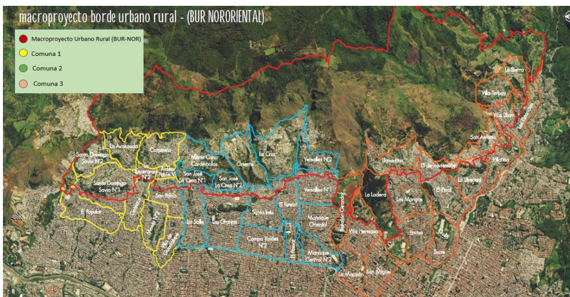
Imagen 2. Mapa de influencia de la Escuela Territorial de Barrios de Ladera. Borde urbano rural, comunas: nororiental y centro oriental de la ciudad de Medellín.

desarrollo local. Durante los últimos años ha desarrollado una iniciativa bajo el nombre de “Escuela Territorial de Barrios de Ladera: por la formación popular, la construcción colectiva y la incidencia”. La Escuela Territorial hace parte del Programa por la Defensa y Transformación Social del Territorio y también es co-liderada por la Mesa de Vivienda Comuna 8 y la Corporación Montanoa (Corporación Con-Vivamos, 2018) 9 . Las propuestas comunitarias, así como los proyectos que desarrollan estas organizaciones, tienen lugar en el amplio sector del “macroproyecto borde urbano rural”, al costado nororiental de Medellín, en la parte alta de las comunas 1, Popular; comuna 3, Manrique; y comuna 8, Villa Hermosa, como se observa en el mapa (Imagen 2).