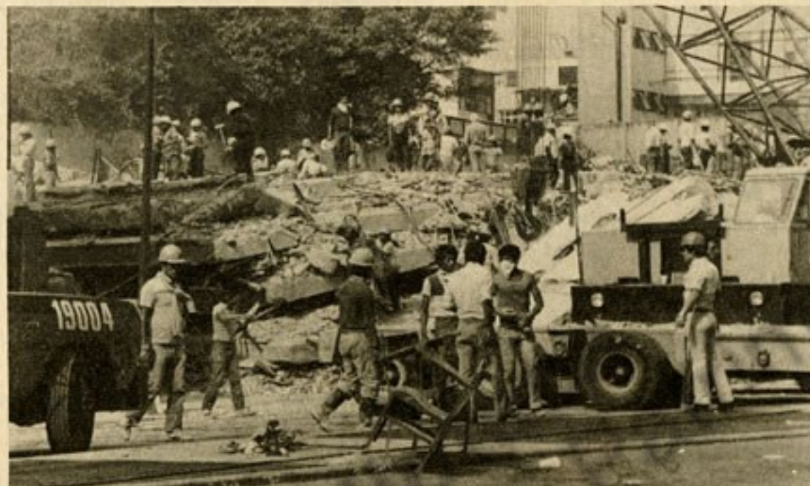
Abundan los hospitales de campaña, a lo largo y lo ancho de la ciudad de México. En cualquier esquina, el personal médico improvisa centros de atención urgente a los heridos que salen angustiados de entre los escombros.