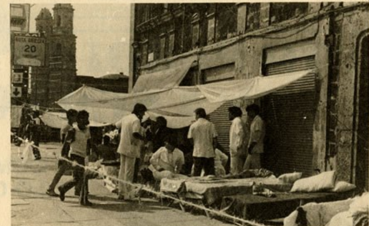
La incertidumbre y la angustia se acentúan en los rostros y los ademanes de los miles y miles de voluntarios que participan en la acción humanitaria de rescate de posibles sobrevivientes y de remoción de escombros en la zona del desastre en México.

Algunos de los tradicionales centros nocturnos más populares, incluso los calificados de dudosa moralidad habían dejado de funcionar como tales y se habían convertido en improvisados albergues y centro de descanso y refrigerio para los socorristas y fuerzas de seguridad.