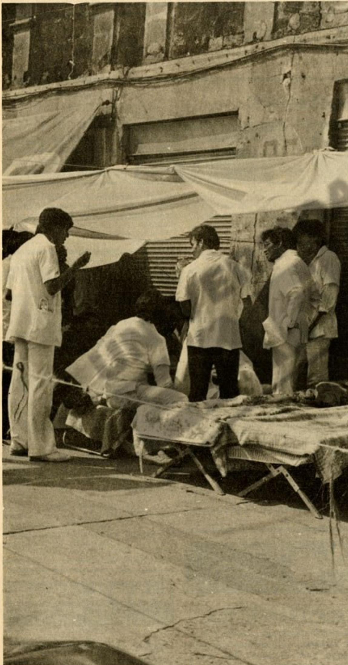
Escenas desgarradoras muestran en toda su crueldad y su crudeza la magnitud de la tragedia vivida por el pueblo mexicano como consecuencia del pavoroso terremoto. La capacidad del personal médico se ha multiplicado hasta lo imposible.