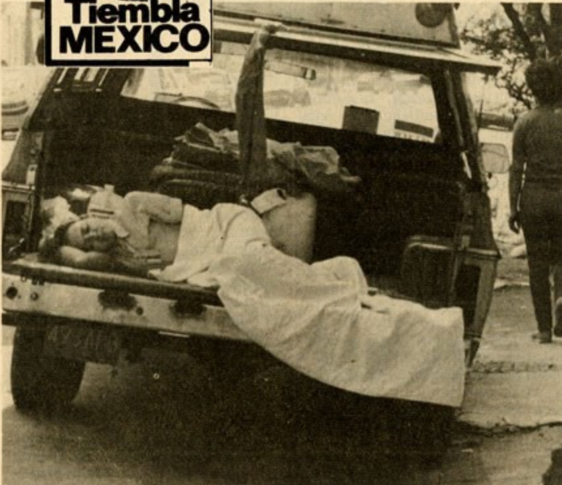
El dolor y la desesperación están en todos los lugares. Y en todos los lugares hay ahora cabida para los heridos y los damnificados. La solidaridad general se ha despertado con motivo de la dura prueba que azota a México.

El testimonio es sólo uno de tantos. Su patetismo se ha visto superado por los patéticos casos que todavía se suceden en esta capital.