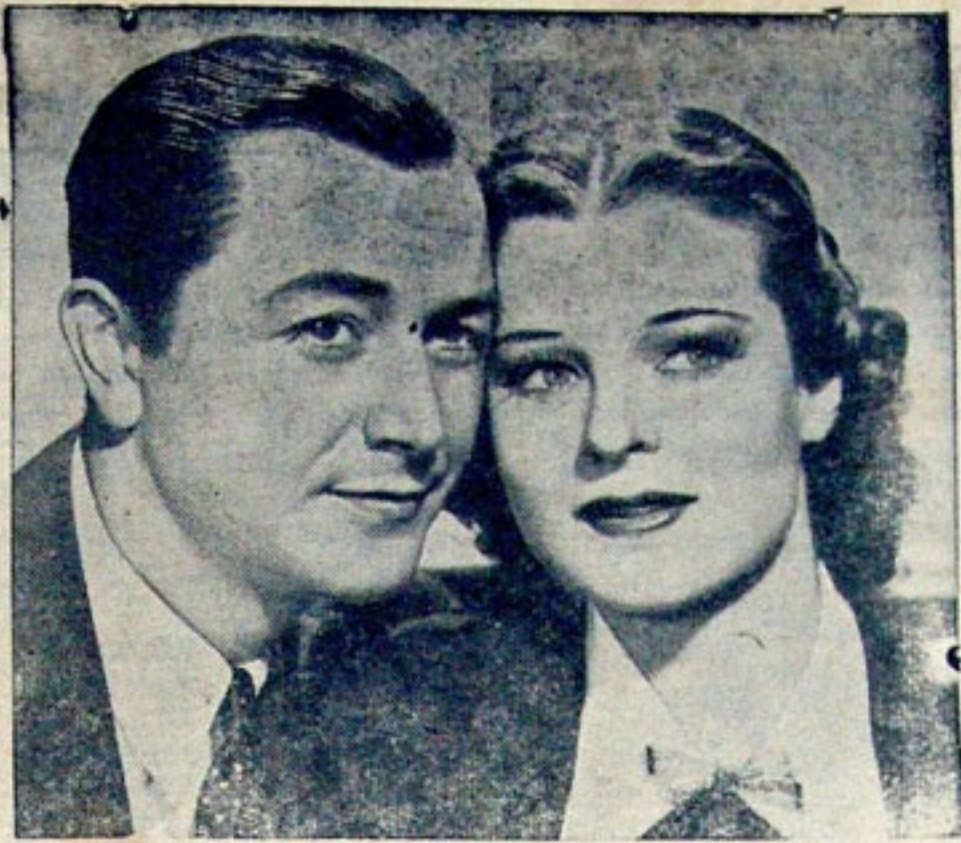
ROBERT YOUNG y RUTH HUSSEY, en la comedia Metro, "Don Amor y Don Dinero", que estrena el Teatro Avenida el próximo sábado 1° de Junio.

HORARIO: estaba anunciada la película para las 6 y sólo vino a iniciarse a las 6 y media, gracias a los amigos de la galería que hicieron huelga y fueron a la taquilla a reclamar su dinero; entiendo que la demora se debió a que la cinta se daba en "cadena" con el María Victoria; asimismo entiendo que no hay razón para demorarlo a una media hora más por causa de las tales "ca-