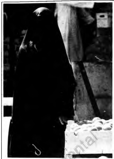
¡Hola! ¿Hay alguien ahí? Una mujer, dicen los fotógrafos. Una dama de la comunidad shiita de Arabia Saudita. De la revista Time.

Tras el velo... ¿Si habrá buenos, si habrá feos, si habrá malos?