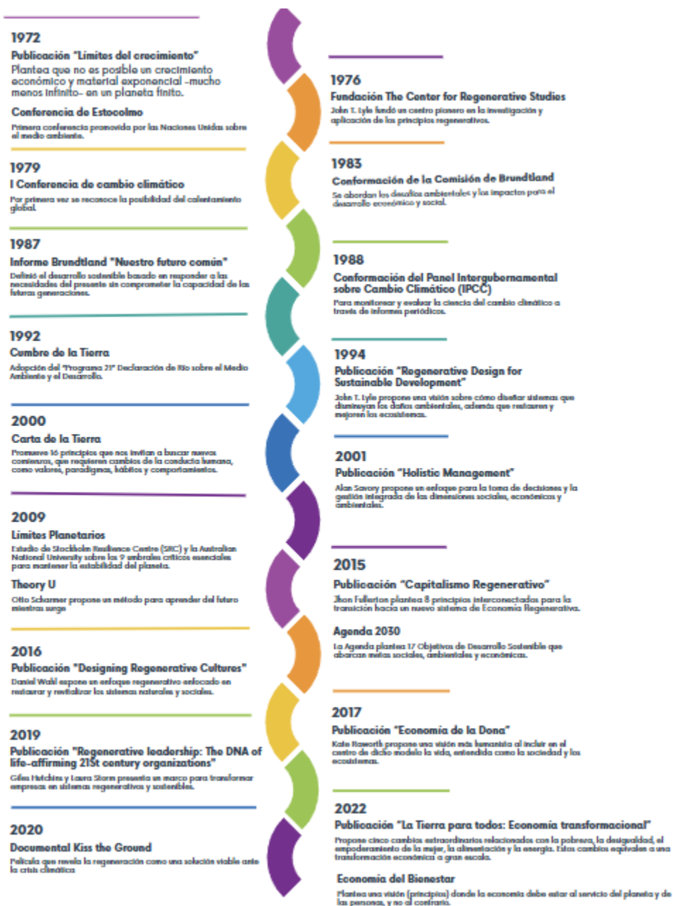
Figura 2: Hitos del pensamiento emergente