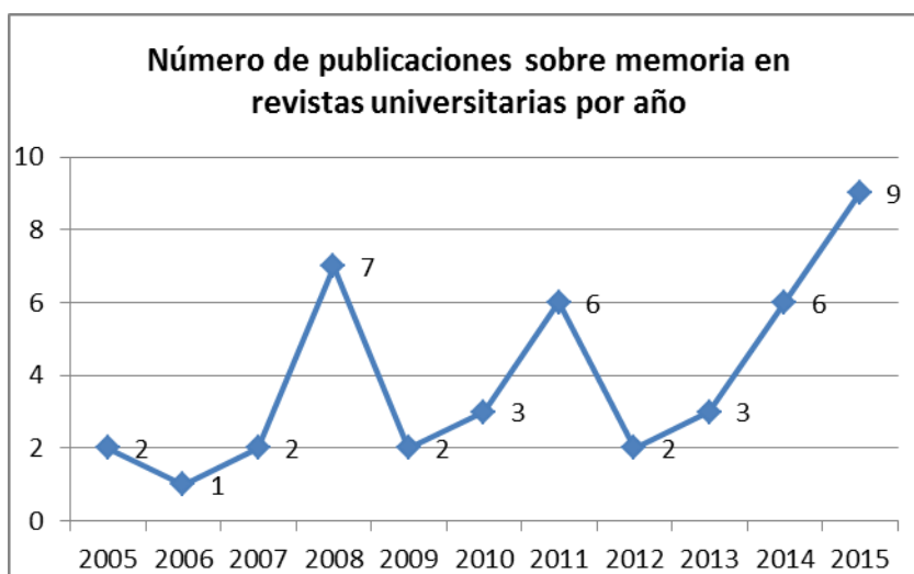
Gráfica 1. Número publicaciones de memoria por año.