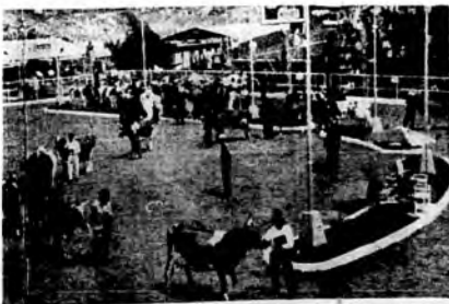
Personalidades del mundo artístico se presentaron ayer a partir de las cuatro y entraron al salón de la tarde en los patios de La Llorona, para celebrar la celebración de la Semana Cultural iniciada en el establecimiento de recepción desde el lunes pasado. (Foto EL COLOMBIANO, LUIS MARCHI).

▼ El padre Superior y la Comunidad de los Padres del Corazón de María, se permiten el honor de nombrar a usted madrina del ángel de la Guarda del