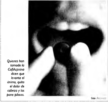
Quienes han tomado la CafAspirina dicen que levanta el ánimo, quita el dolor de cabeza y las penas pilosas.