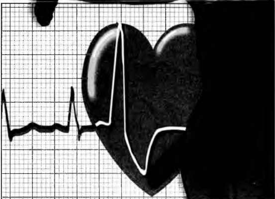
Composición gráfica: Ramiro Zapata M. Depto de Arte - EL COLOMBIANO