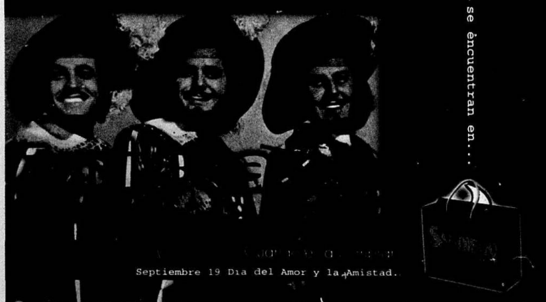
Septiembre 19 Día del Amor y la Amistad.