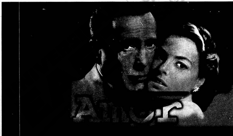
Cuando el Amor y la Amistad se juntan

Las sanciones van desde la amonestación hasta la cancelación del establecimiento.