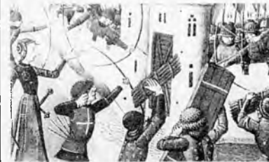
Juana de Arco, liberó algunas poblaciones. Le ayudó a Francia en su lucha contra los ingleses.