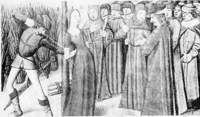
Juana de Arco no había cumplido 20 años. Y la quemaron en la hoguera.