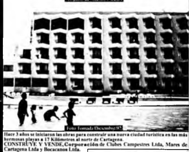
Hace 3 años se iniciaron los obras para construir una nueva ciudad turística en las más hermosas playas a 17 kilómetros al norte de Cartagena.

HOY ES UNA HERMOSA REALIDAD Y UNA GRAN APERTURA TURISTICA