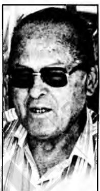
Me hace falta el parque

"Relatarse". "Me hace falta estar tomando fotos, en el Parque. El