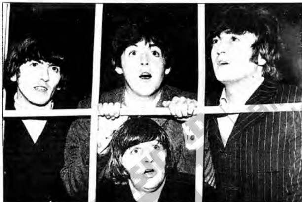
¡Sorpresa! Una revolución musical. Y humor, de raps. Los Beatles que tanto dieron a la juventud de los años sesenta.