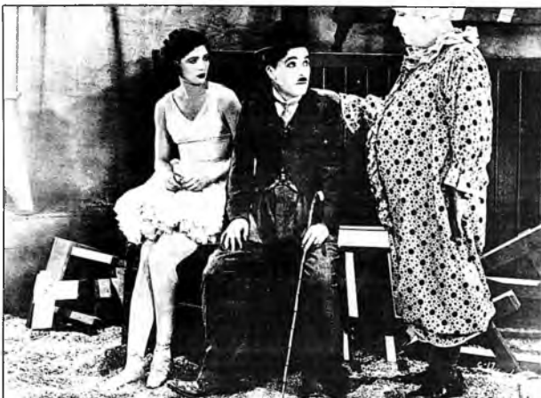
¿Entonces, qué? Charles Chaplin en El Circo. Píñillado entre los más recordados del cine.