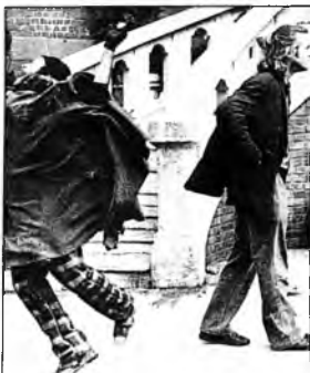
Sólo ilusiones Pescador de ilusiones, comparte con Danza con lobos y El silencio de los inocentes, el primer lugar en el recuerdo de las películas de la generación de los 90.

Libros: El Anal, De aquí a la eternidad, colección el Tesoro de la Juventud y novelas (2). Autores: Rafael Pérez Pérez (3), Tomás Carrasquilla (2). Pinturas: Cubismo, desnudos y barequeras, paisajes, los dioses del Palacio Municipal, La maja desnuda, Las meninas, La monalisa, La Bachué y La madonna. Artistas: Pablo Picasso (8), Pedro Nel Gómez y Enrique Gómez Campuzano (5), Salvador Dalí (3), Ignacio Gómez Jaramillo, Eladio Vélez, Horacio Betancur y Humberto Chaves (2). Música: Boleros (7), merengue y cha-cha-cha (3) y mambo (2). Intérpretes: Lucho Bermúdez (7), Los Tres Diamantes y Los Panchos (6), Alfonso Ortiz Tirado, Pedro Vargas, Leo Marini, Elvis Presley y Matilde Díaz (3), Lucho Gatica, Los Romaneros, Rufino Duque (2).