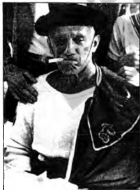
Torero, torero... Por algo le dio a Pablo Picasso, en la celebración de sus 90 años. Marca la parada entre los artistas del siglo.