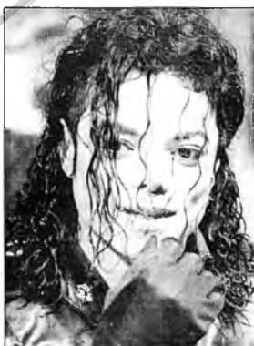
La metamorfosis Michael Jackson un ídolo musical y un ejemplo de la metamorfosis.