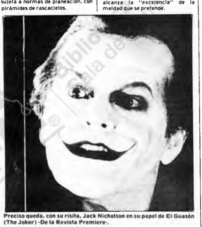
Prezco queda, con su risita, Jack Nicholson en su papel de El Guasón (The Joker). De la Revista Premiere.

Pero el Batman (Michael Keaton) obsesionado por el bien, y El Guasón (Jack Nicholson) obsesionado por el mal, no tienen la fuerza de la definición. Los dos comprenden que tienen que destruirse mutuamente. Pero Batman es temeroso, vacilante y no sale de los tiros flojos de siempre. Y El Guasón alcanza la "excelencia" de la maldad que se pretende.