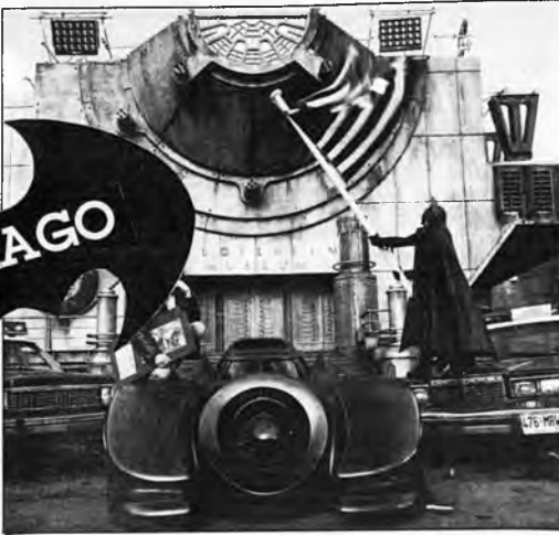
Quería un aire bien chévere, pero "macho e intimidante". Del diseño se encargó Anton Furst. Y cuidado con un varillazo de Batman, Anton... De la revista Life.

Y agregan los críticos, hay unos cuantos "Bati-gazapos" en el filme. El Guasón cae en una caneca de basura tóxica que "vuelve nido" su rostro pero no le quita ni le agrega una arruga a su traje. Hay un museo que aparece con dos nombres distintos. En una escena en la que El Guasón tira en plena calle 20 millones de dólares, la gente ni se mosquea ni se le lanza encima. Y no hay respuesta a una pregunta que durante la primera hora de la película se formula: ¿qué ocurrirá cuando Vicki descubra la verdadera identidad de Batman?