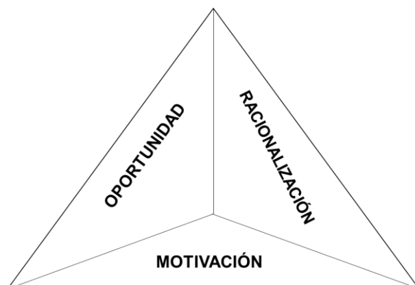
Ilustración 1. El triángulo de riesgos