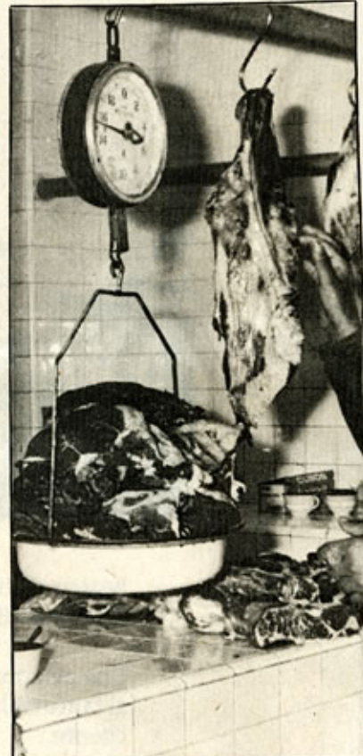
Centro de producción. Transporte a Medellín. Feria. Comisionistas. Distribuidores de carne. Una larga cadena de comercialización indirecta -Foto Archivo-

La Ll Per cotiz más com Ll que peso cien Ll cam otra enca Ll peso calc difer UN En Entr auto Feri Qu el v cien alca la of al ar eso, La expe Fija filigr OF La dem ¿S inve pagu anim Es de la cuar alim deba oper de 3 proc Es enca o m invi agos sept a fin Es cos