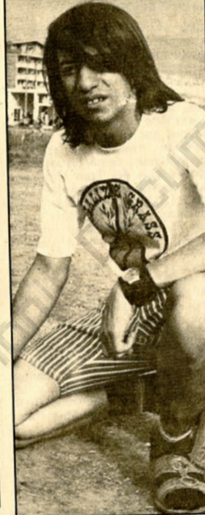
¿Cómo me le pinta los relojitos que estaban de moda? ¿Y las sandalias? Fue el famoso Carolo.

con sus tacones altos. Bailaba. Y que había sido novia de Negret, aseguaba la dama.