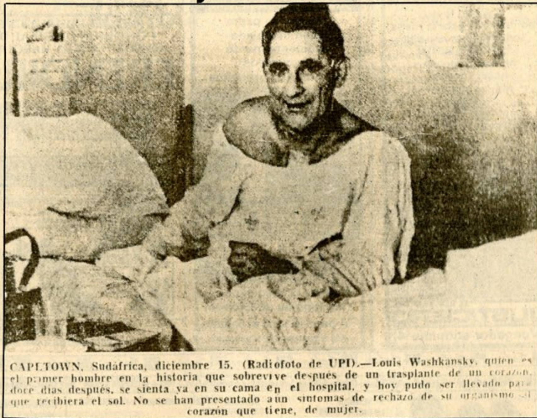
CAPTOWN, Sudafrica, diciembre 15. (Radiofoto de UPD).—Louis Washkansky, quien es el primer hombre en la historia que sobrevive despues de un trasplante de un corazón, doce días despues, se sienta ya en su cama en el hospital, y hoy pudo ser llevado para que recibiera el sol. No se han presentado aun sintomas de rechazo de su organismo al corazón que tiene, de mujer.