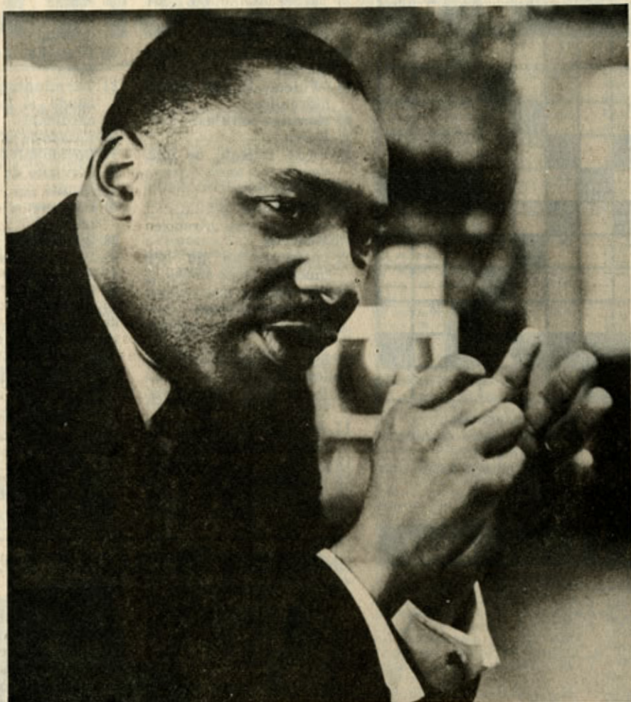
"No nos queda otra alternativa que protestar" Martin Luther King