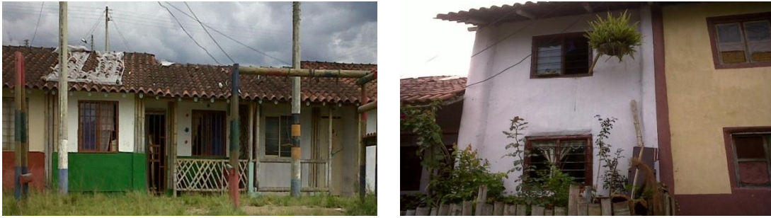
Figura 6.12 Fachada casas elaboradas en guadua en los barrios el Italiano, el Europeo y Coovinoc.