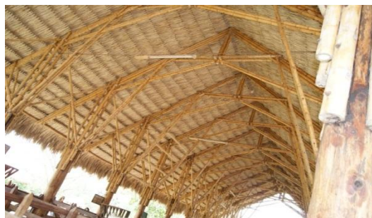
Figura 6.16 Puente peatonal y cubierta de un establo en PANACA.