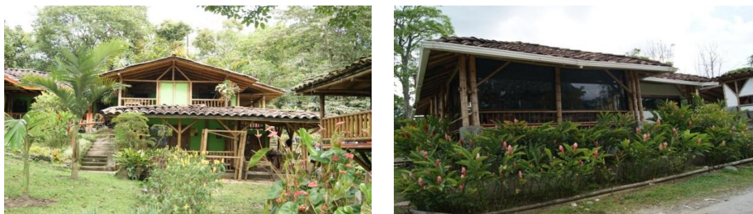
Figura 6.10 Fachada casa Hernando González y de su madre en Combia.