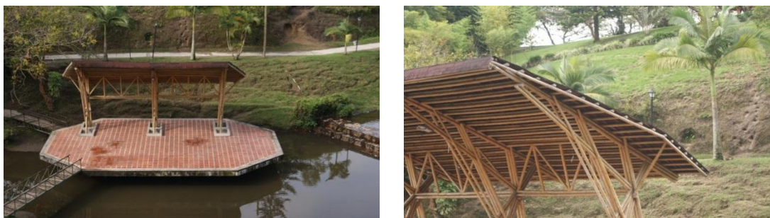
Figura 6.7 Estructura y cubierta Concha acústica.