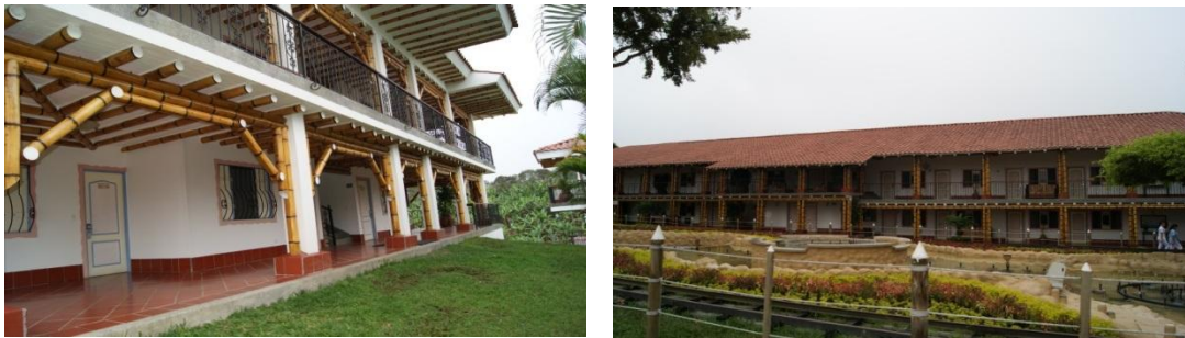
Figura 6.13 Estructura cabañas de habitaciones hotel Las Camelias.