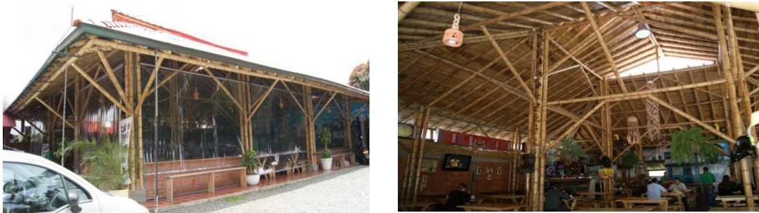
Figura 6.4 Fachada y cubierta restaurante Aquí está Harry.