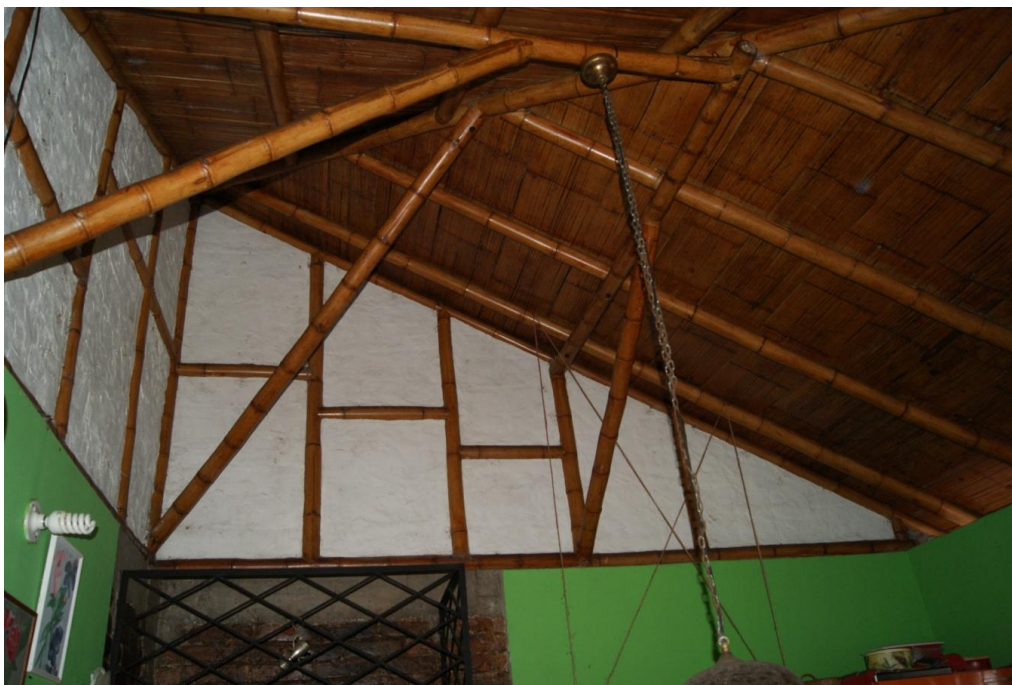
Figura.5.3 Ejemplo de muro tendinoso en una casa ubicada en el municipio de Calarcá, Quindío.