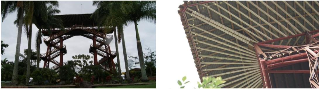
Figura 6.15 Estructura y cubierta Mirador del café, en el Parque Nacional del Café.