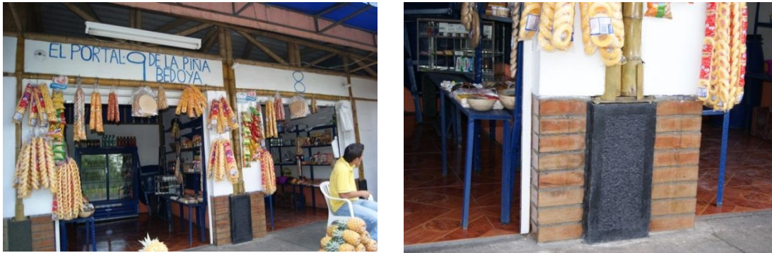
Figura 6.2 Puesto de venta Parador Cerritos.