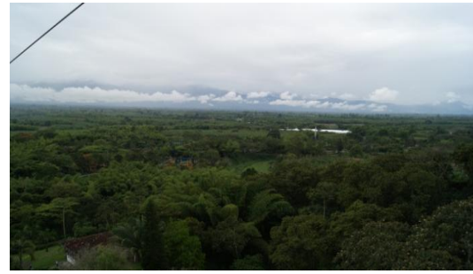
Figura 6.14 Caseta de teleférico y gradual en el Parque Nacional del Café.