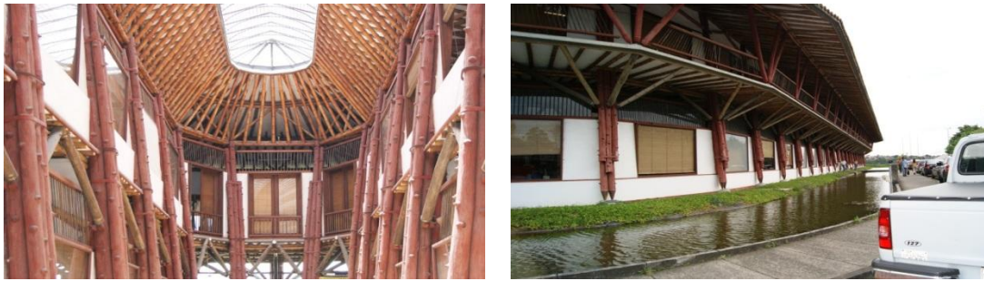
Figura 6.6 Interior y fachada Arca de Noé.