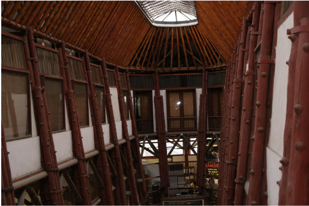
Figura 5.5 Sede de la Corporación Autónoma Regional de Risaralda CARDER, también conocida como el Arca de Noé ubicada en la ciudad de Pereira.