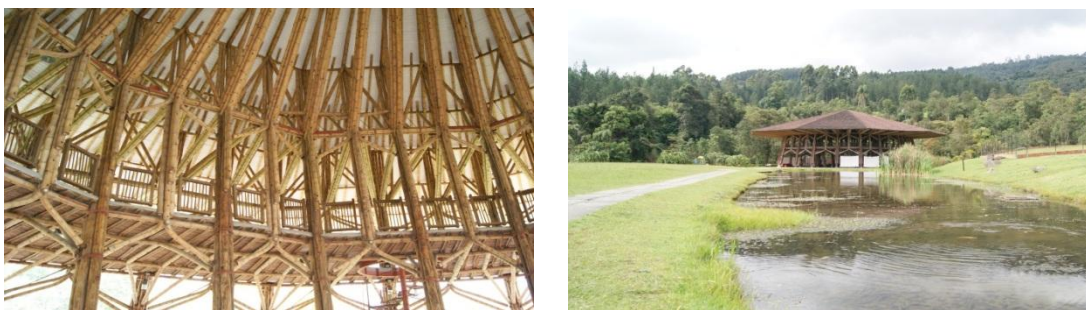
Figura 6.5 Estructura Recinto del pensamiento.