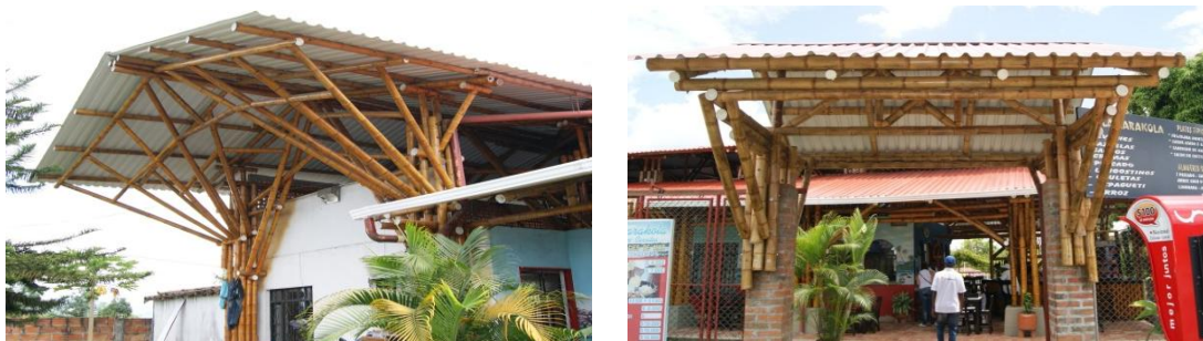
Figura 6.1 Cubierta y entrada principal restaurante La Karakola de Cerritos

Durante este trabajo de campo, se hicieron visitas a diferentes lugares, con el fin de indagar sobre los diferentes tipos de estructuras construidas con guadua, y así poder evaluarlas desde los diferentes principios que eran relevantes para este proyecto; es decir, desde la sostenibilidad, obteniendo los resultados que se muestran en las siguientes fichas.