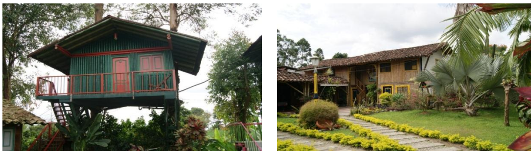
Figura 6.9 "Casa en el aire" y cabaña en el Hotel KARKAKÁ