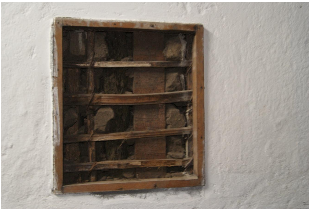
Figura 5.2 Ejemplo de casa construida en bahareque encementado ubicada en el municipio de Circasia, Quindío.

Dentro del trabajo de campo realizado en el eje cafetero se vieron varias casas que se conservan construidas con bahareque encementado, en municipios como Circasia, Filandia y Calarcá; estas construcciones alcanzan edades de hasta 100 años, resistiendo incluso al terremoto del eje cafetero en 1999, algunas de estas han sido restauradas. Se ven también construcciones nuevas, donde este sistema constructivo se ha venido retomando, demostrando que esta técnica representa nuestra cultura ancestral.