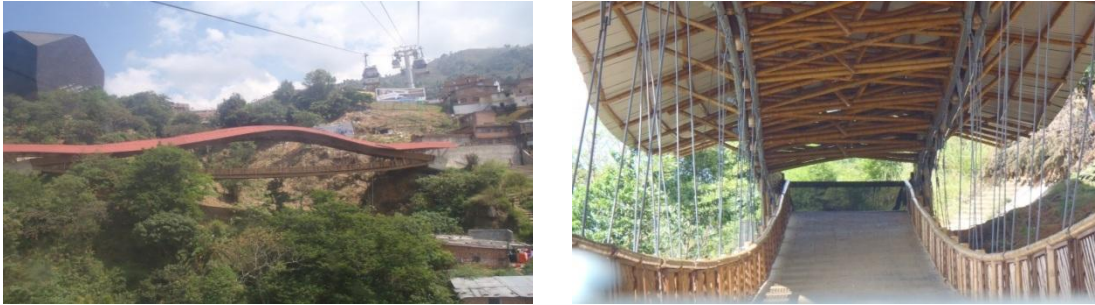
Figura 6.18 Estructura puente en guadua Santo Domingo Sabio.