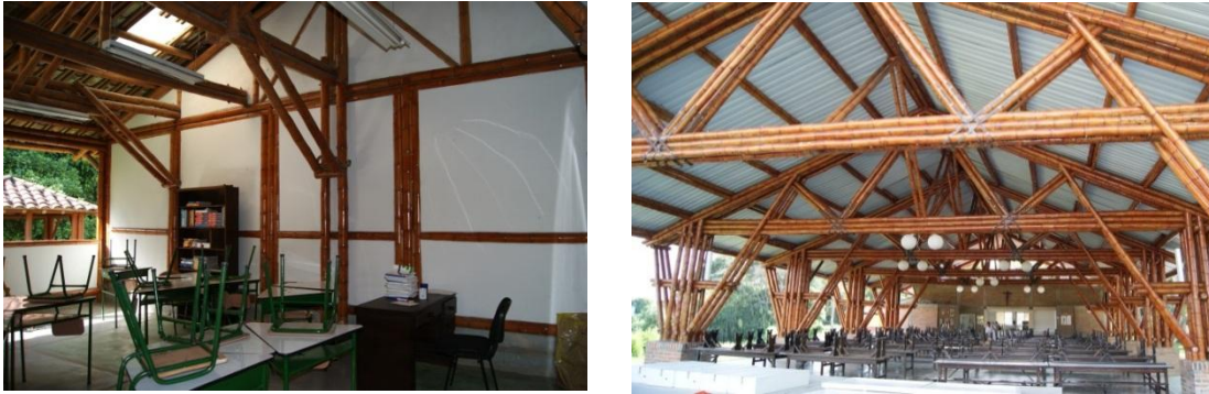
Figura 6.3 Salón de clases y comedor Liceo Pino Verde.