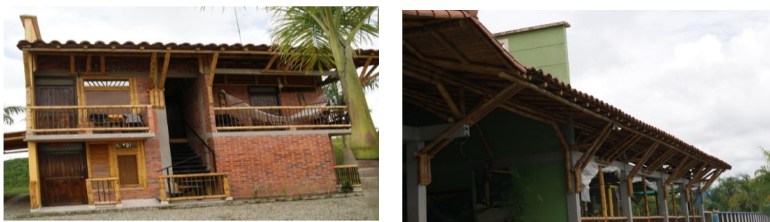
Figura 6.17 Cabaña y restaurante del Hotel Palmas de Santa Helena.