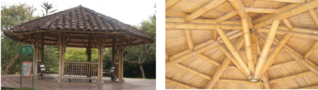
Figura 6.8 Estructura y cubierta kioscos ubicados en el Parque de la Vida.