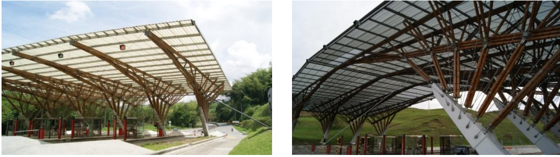
Figura 6.19 Estructura peajes de Circasia y Las Pavas.