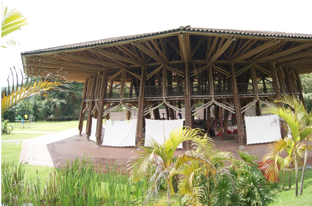
Figura 5.4 Recinto del pensamiento ubicado en las afueras de la ciudad de Manizales.

Las investigaciones y aportes realizados por los arquitectos antes mencionados, han contribuido con la inclusión de la guadua dentro del Reglamento Colombiano de Construcción Sismo Resistente NSR-10, y además esto ha hecho que tome fuerza de nuevo este material, ya con una connotación de material arquitectónico.