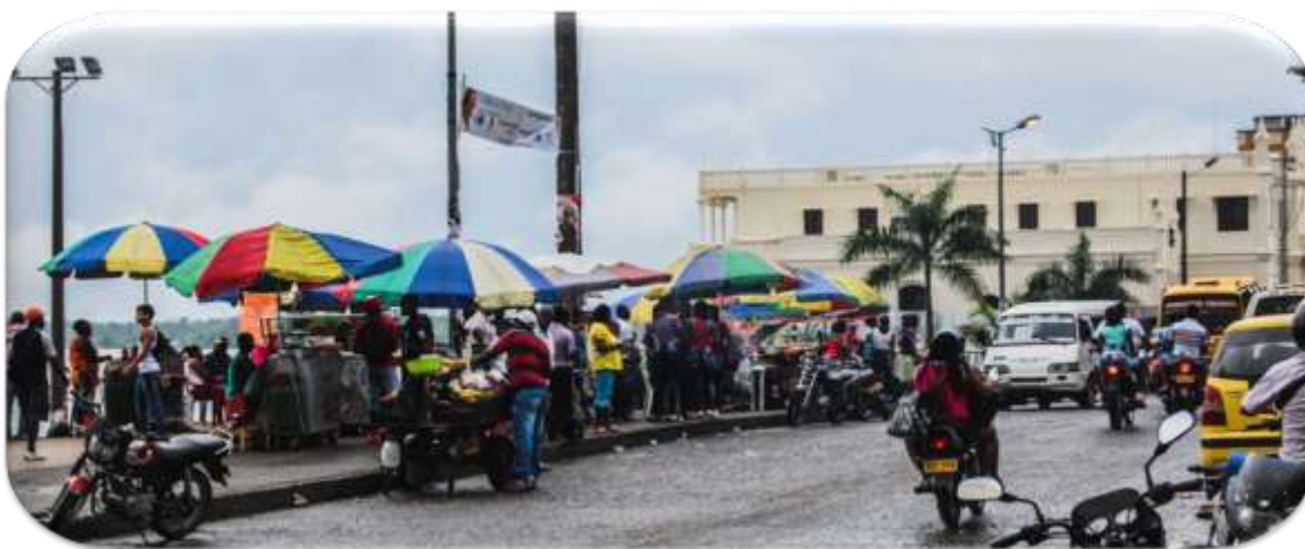
Foto: Carrera primera centro de Quibdó, malecón a orillas del río Atrato. 08/2014.

Quibdó urbano vive hoy una crisis social y económica, reflejada en el “rebusque” de la gente para sobrevivir, y se visibiliza en la ocupación del espacio público de las principales calles y barrios céntricos de la ciudad, por vendedores informales ambulantes y estacionarios; en este sentido, el trabajo informal en el municipio al igual que en resto del país, se ha convertido en una problemática social de grandes dimensiones, en la medida, en que ni el gobierno nacional, ni los gobiernos locales, han logrado ser efectivos en la implementación de Políticas Públicas, programas y proyectos diseñados a través de los años