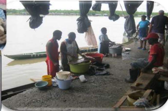
Foto: Orillas del río Atrato, parte posterior plaza de mercado.

lados algunas costumbres enmarcadas en actuaciones solidarias y de ayuda mutua, conservan aún sentimientos y actitudes sanas llenas de valores morales y éticos; provenientes de la zona rural de Quibdó, de otros municipios y departamentos vecinos como: Corregimientos de Munguido Playa Alta, Puerto Conto, municipios de Atrato, Rio Quito, Carmen de Atrato, Medio Atrato, Baudó, Condoto, Tadó, departamentos del Valle del Cauca - buenaventura, Buga; Antioquia-apartado, Bolivar; Risaralda – Ancerma Nuevo.