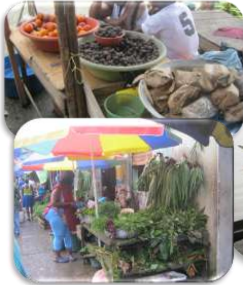
Foto: Frente plaza de mercado.

Las personas inmersas en actividades de la economía informal, son seres humanos humildes, de costumbres campesinas que aún en la dinámica de la ciudad no han dejado de