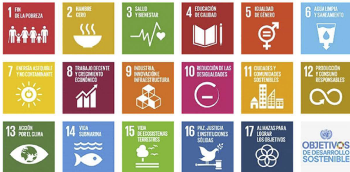
Figura 2. Objetivos de desarrollo sostenible ODS.

La Fundación CFA contribuye directamente al avance de 6 de los 17 objetivos de desarrollo sostenible.