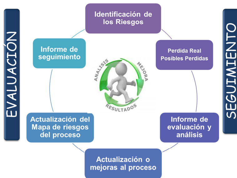
Figura 4. Proceso sistémico administración del riesgo operativo. Manual SARO 2012.

Se cruzan riesgos potenciales con el método desarrollado por CFA para la medición y evaluación del riesgo operativo SARO: