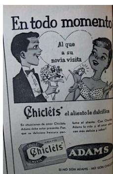
Figura 12. Chiclets Adamas. (1958). Revista Cromos , 86(2136), p. 59

En la sección Sociedad aparecieron matrimonios que se celebraron entre el hombre y la mujer de la clase alta. En las fotografías de ésta sección son notorios los vestidos de matrimonio ostentosos, los abrigos de piel en los invitados y la guardia militar de honor mientras los novios recorren la alfombra. Las parejas estaban compuestas por el hombre ya establecido, productivo, protector y proveedor del hogar, y la mujer de sociedad, orgullosa de cumplir con su deber social y moral al haber conseguido un esposo honorable, dispuesta a ocupar el lugar de la administradora del hogar y la madre, testimonio de la virilidad de su esposo al hacerlo padre, condición viril significativa de la que dio cuenta la publicidad y de la que se valió para inducir el consumo.