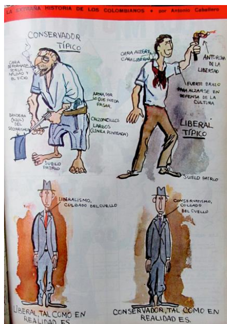
Figura 56. Caballero, Antonio. (1962). La extraña historia de los colombianos. Revista Cromos , 91(2327), p. 63.

El cuerpo saludable y en forma continuó reflejando la belleza moral y física del Hombre Moderno, quien mantuvo la práctica del tenis, el polo y el golf. Sin embargo, en la década del sesenta, se hizo popular el billar como un juego de todas las clases sociales, pero que la clase alta apropió como un espacio masculino que implicó destreza mental y que los hombres modernos usaron como excusa para disfrutar tiempo de ocio con los amigos (Salazar, 1967, p. 64). El cuerpo feo (descuidado, desproporcionado, desarreglado y flácido) y el cuerpo enfermo (decadente, cansado y adolorido) se mantuvieron como los opuestos al ideal del cuerpo armonioso e integral del Hombre Moderno. En la revista, estos se continuaron evidenciando en los anuncios publicitario, sin embargo, Cromos se valió de este precepto para hacer una crítica política en sus páginas a través de una caricatura de Antonio Caballero: