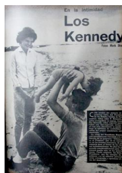
Figura 40. En la intimidad: Los Kennedy. (1961). Revista Cromos, 90(2318), p. 23.