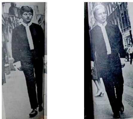
Figura 63. Restrepo Trujillo, J. (1965). Adivinen cual es el hombre? Revista Cromos , 111(2475), p. 1.

Restrepo representó la opinión del Hombre Moderno que convirtió, lo que era un estilo de vida para los jóvenes Mods de Inglaterra, en un chiste y así buscó quitarle validez a esa extraña y externa realidad. Se valió de la virtud masculina de la fuerza de voluntad, para exponer como el hombre era el que naturalmente la poseía y como su contrario, la mujer, era la que no, de ahí su histeria por el ratón. Al finalizar el artículo expresó: “[...] Las mismas camisas de seda y el cuellito color malva harán, sin duda, que ellos sean “modernos” y nosotros oscurantistas. En todo caso el truco del ratón de caucho sería lo más apropiado” (Restrepo, 1965, p. 19). Es evidente su resistencia, como Hombre Moderno, a esto que acontecía en otras partes del mundo con los jóvenes, por eso reiteró lo absurdo de la situación.