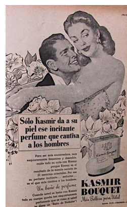
Figura 11. Kasmir Bouquet: Más belleza para usted. (1951). Revista Cromos, LXXI(1793), p. 31.