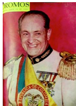
Figura 3. Sr. Presidente General Gustavo Rojas Pinilla. (1954). Revista Cromos , 78(1938), p. 1.