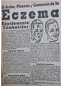
Figura 26. Revista Cromos. (1950). LXIX(1714), p.13.

con mucho cabello, sin estar bien peinado, de cuerpo flácido y bajo, desarreglado, sin vestir adecuadamente, con acné, etc.