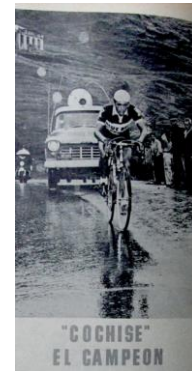
Figura 43. “Cochise”: El Campeón. (1964). Revista Cromos , 93(2447), p. 4.