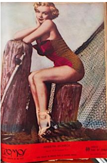
Figura 24. Revista Cromos , (1951). LXXI(1795), p. 1.

La belleza femenina del mundo de Hollywood que el hombre moderno deseó, ya que si había un galán a quien emular, debía haber una mujer para ese galán a quien codiciar, la representó Marilyn Monroe. Esta actriz tuvo la mayor cantidad de portadas y artículos, sobre mujeres del mundo del cine, rastreados en la revista Cromos (42), superando a otras actrices como Ingrid Bergman, Elizabeth Taylor, Sofía Loren, etc., que también eran centro de atención. En ella se resaltaron cualidades como la delicadeza, la inocencia, la insuperable belleza y la seducción: