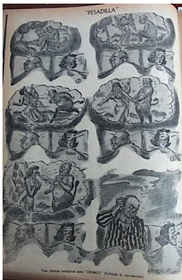
Figura 33. “Pesadilla”. (1950). Revista Cromos , LXX (1747), p. 50.

marido, hijo, que requiere el marido, cocinera, absolución, regaños, admoniciones y muerte” (Revista Cromos, LXXV(1905), 1953, p. 11).