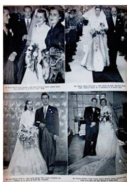
Figura 13. Sociedad. (1953). Revista Cromos , LXXV(1869), p. 32