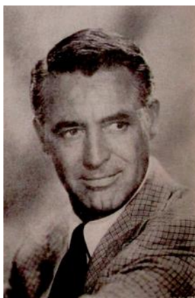
Figura 51. Cary Grant estrena canas. (1965). Revista Cromos , 112(2484), p. 8.