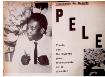
Figura 42. Pelé. (1962). Revista Cromos , 91(2323), p. 26.