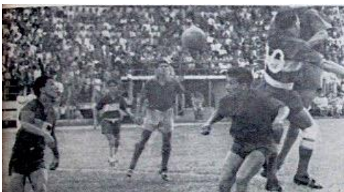
Figura 4. Deportes. (1950). Revista Cromos , LXIX(1735), p. 24.

El ciclismo también tuvo tiempos difíciles, los ciclistas eran considerados hombres con una gran voluntad para superar los obstáculos de la naturaleza y el rigor de la geografía del territorio nacional, pero no llamaron la atención del país hasta la creación de la Vuelta a Colombia, en 1951, en ésta el triunfo de Efraín “El Zipa Forero” significó la victoria del hombre viril. A partir de ese momento, este deporte ganó afición y en pocos años contó con la dirección de hombres que llegaron a destacarse por su carrera deportiva y que entendieron las complicadas situaciones de aquellos que se ganaban la vida pedaleando (Forero, 1951). Aunque no recibió mayores recursos, si ofreció mejores garantías a practicantes y dirigentes y los promotores lucharon por el reconocimiento de éstos, no sólo por sus atributos y condiciones físicas, sino por su lugar en una sociedad moderna: “por eso saben cómo manejar un deporte y por eso han podido colocar al ciclismo en el primer plano, si se quiere, y la orientación de esta actividad está forjando un futuro cada vez más brillante” (Forero, 1951, p. 33).