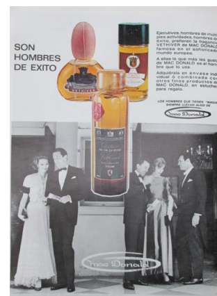
Figura 59. Mac Donald. (1967). Revista Cromos, 120(2592), p. 3

En los sesenta, este Hombre Moderno (masculino) continuó validándose como hombre (virilidad y hombría) al oponerse a lo femenino. Demostró su estado de poder superior al dejar de lado todas las cosas femeninas y se concentró en usar y acumular su poder, no sólo en lo físico y lo sexual, sino en lo social, lo político, lo financiero y lo intelectual (Keen, 1999). La mujer que acompañó a este tipo de hombre, es decir la Mujer Moderna tradicional, expuesta en el capítulo anterior, se mantuvo bajo su dominio y su relación permaneciendo bajo la mirada de los contrarios: el hombre representó el control de las emociones y la mujer la falta de control de éstas. El hombre era el proveedor, el trabajador