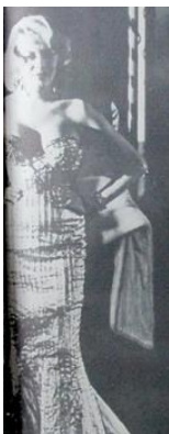
Figura 64. El hombre que se volvió mujer. (1962). Revista Cromos , 91(2352), p. 16.

Cromos presentó esta historia como información. Como medio de comunicación no expresó opinión, no obstante, en su introducción expuso, en mínimas palabras, la inquietud que esta historia le generó a la revista, es decir, al Hombre Moderno: “[...] Se trataba nada menos que de la famosa (o famoso?) Coccinelle. La misma que ocho años antes figuraba en la libreta militar como Jacques Charles” (Revista Cromos, 1962, p. 16). Al hacer la pregunta “(o famoso?)” se deja en claro que esta era una situación que todavía no sabía cómo nombrar, una situación extraña, ajena a la estructura del Hombre Moderno y de la sociedad colombiana de los sesenta.