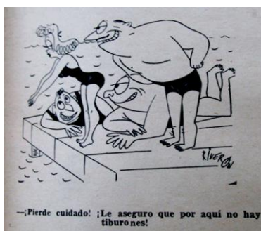
Figura 15. Riverón. Caricatura. (1953). Revista Cromos , LXXV(1884), p. 12.

El Don Juan era el hombre que se acercaba a la mujer mediante el engaño, haciendo promesas que no cumplía. El hombre conquistador, quien presentaba dificultad para establecer una relación personal con la mujer, pues la consideraba sólo como un objeto de su placer y después de obtenerlo le daba su desprecio (Sáenz, 1969). En Cromos apareció reflejada una de las conductas del Don Juan de forma caricaturesca, el hombre que engaña y que sólo quiere sacar provecho de su situación para garantizarse el placer de poseer a la mujer. La necesidad de comer para saciar el hambre: