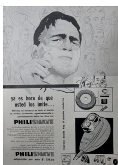
Figura 17. Philishave. (1959). Revista Cromos , 88(2180), p. 21.