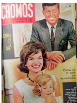
Figura 39. Revista Cromos. (1960). 90(2266), p. 1.

John Fitzgerald Kennedy era el modelo de virilidad a seguir, el caballero de aspecto digno que representaba el valor y las virtudes físicas y morales de un hombre de bien: “[...] una sonrisa bondadosa, casi infantil, y en su talante había un inconfundible sello de sencillez, y de finos y pausados modales que inspiraban una irresistible simpatía de la que se derivaba un magnetismo difícil de explicar” (Revista Cromos, 92(2416), 1963, p. 34). Además, un hombre de familia, varios de los materiales hallados en Cromos mostraron este aspecto viril, tan relevante, del hombre más poderoso del mundo: