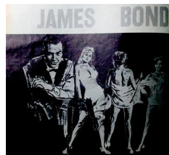
Figura 52. Sean Connery en James Bond. La fabulosa leyenda de James Bond. (1966). Revista Cromos , 117(2553), p. 8.