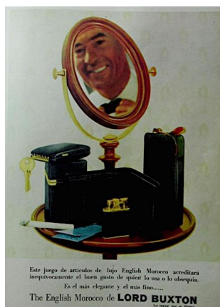
Figura 58. Lord Buxton. (1960). Revista Cromos, 90(2256), p. 27.