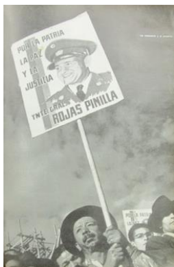
Figura 2. Rojas Pinilla. (1953). Revista Cromos , LXXV(1891). p. 29

La imagen de la hombría en Colombia también la representó el Presidente Gustavo Rojas Pinilla. Su imagen era una de las más frecuentes, en la Revista Cromos, durante su periodo de gobierno (1953-1957) (45 materiales rastreados). Su llegada victoriosa al poder dio muestras de su valor al tomarse el máximo cargo al que un hombre podía aspirar en un territorio, ser el presidente, en ese momento era la figura del hombre militar honrado y de honor, se resaltaron en él cualidades como la integridad: