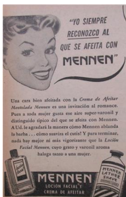
Figura 6. Mennen. (1950). Revista Cromos, LXIX(1718), p. 25.