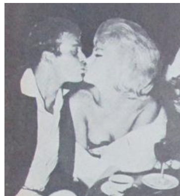
Figura 66. El hombre que se volvió mujer. (1962). Revista Cromos , 91(2352), p. 18.