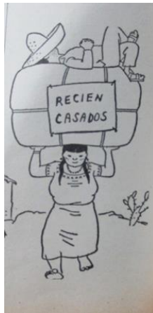
Figura 61. Recién Casados. (1964). Revista Cromos , 93(2453), p. 64.

Tal como en la década del cincuenta, era el hombre que se relacionó con los otros (esposa e hijos) desde una posición superior, generalmente imponiendo su poder de forma autoritaria y violenta. La Revista Cromos lo continuó presentando como un opuesto del Hombre Moderno y lo ilustró como el hombre inútil de clase social baja, que sometió a su esposa y en ella descargó todas las responsabilidades.