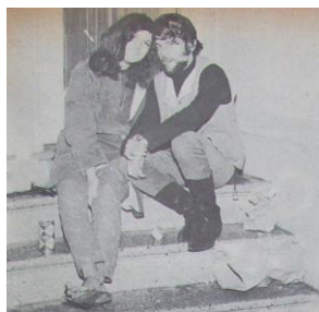
Figura 62. Hinestrosa, Dukardo. (1967). Los Hippies. Última locura alucinante. Revista Cromos , 122(2610), p. 9.

[...] Hippieland está enquistada en un vasto sector negro; sus calles se ven siempre sucias y de las viejas casonas que lo componen, medias, camisas, batones, blue jeans y desgastadas mantas flotan en sus balcones, asoleándose como desiguales banderas de derrota. Sus pasillos y vetustos porches están siempre llenos de parejas haciéndose el amor, recontando las cuentas de viejos collares, fumando hasta reventar, en alucinantes monólogos o recitando al viento poemas intrascendentes (Hinestrosa, 1967, p. 8).