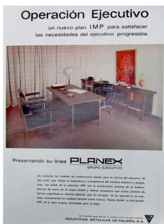
Figura 57. Planex. (1967). Revista Cromos, 120(2592), p. 4

El Hombre Moderno, de la década del cincuenta, se mantuvo en los sesenta sosteniendo el ideal de ser un Hombre de Verdad, el cual, debió tener como mayor cualidad la actitud activa y productiva; era fundamental en él la seguridad en sí mismo y el establecerse en un lugar de poder que le permitiera acceder al éxito y al progreso, acciones que eran requeridas por el sistema capitalista y su estructura de consumo, además, por un país con proyectos modernizadores. Este hombre dejó de ser exclusivo de la clase alta y la élite del país, ya que los ejecutivos asumieron las virtudes y los ideales de la caballerosidad, por esta razón, en la Revista Cromos, al hombre de éxito también se le denominó Ejecutivo. A este sujeto la publicidad continuó vendiéndole productos que estuvieron relacionados con el lujo, la posición social, la capacidad económica y el poder, de la misma manera que se hizo en la década del cincuenta: