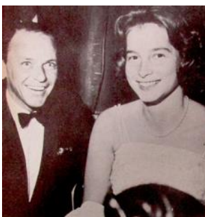
Figura 50. Frank Sinatra. Revista Cromos . (1962). 91(2356), p. 50.

El cuerpo bello continuó siendo un modelo a seguir para los hombres modernos colombianos y los galanes del cine norteamericano e inglés, que aparecieron en Cromos , eran el referente de belleza de los lectores de la revista: