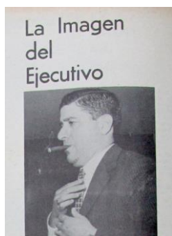
Figura 44. Méndez Puig, H. (1967, 29 de mayo). La imagen del ejecutivo. Revista Cromos , 120(2588), p. 20.

Apareció otro tipo de Hombre Moderno y no era el hombre de clase alta o perteneciente a la nobleza, era El Ejecutivo , perteneciente a la clase media y descrito así: “[...] las estrellas de la clase media, que se visten con saco abierto [...] y no tienen más de 45 años y toman cocteles y ganan más de 200.000 al año, la clase de los ejecutivos surge poderosa, nueva, con capacidad de mando y transformación” (Nieto, 1967, p. 5). A dicho hombre, que adoptó las virtudes del caballero, la clase alta lo cuestionó, ya que se le consideró una competencia y un desafío a la hombría de aquel que había dirigido el proyecto modernizador del país: el industrial, el político y el empresario que se habían ganado un lugar en la élite gracias a su tesón, fuerza de voluntad y la convicción de conservar una herencia tradicional.