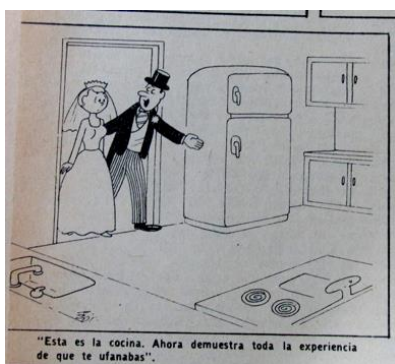
Figura 60. Revista Cromos, (1962). 91(2342), p. 58.

y su presencia era activa en los espacios públicos; la mujer era pasiva, dependiente, protectora y su presencia se requirió en el hogar. Este hombre y esta mujer, en la década del sesenta, se vieron cuestionados por los cambios en la situación social, política y cultural del género femenino, tanto en el mundo como en el país. No obstante, Cromos siguió divulgando su presencia ya que estos eran sus lectores tradicionales, de ahí que continuaran apareciendo contenidos en los cuales se reforzó el rol superior del hombre sobre el rol inferior de la mujer en el matrimonio y en la sociedad: