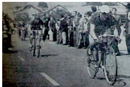
Figura 5. Mike. (1950). Las bajas recaudaciones justifican la Copa Colombia. Revista Cromos , LXX(1753), p. 32. 43