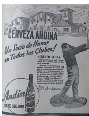
Figura 20. Cerveza Andina. (1950).Revista Cromos, LXIX(1740), p. 3.

En cuanto al cuerpo saludable y en forma, que era reflejo de la belleza, tanto moral como física, se mantenía a través de los deportes. El Hombre Moderno practicó tenis, polo, golf, hípica, entre otros deportes exclusivos y propios de la clase alta del país. Además, los anuncios publicitarios se dirigieron a los hombres mediante el uso de la imagen de los deportistas más reconocidos, destacando en ellos virtudes masculinas como el honor para describir sus productos como superiores: