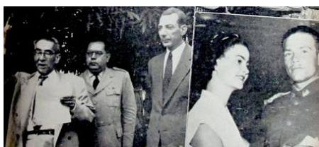
Figura 1. Acontecimientos del Mundo. (1951). Revista Cromos , LXXI(1767), p. 23. 42

El hombre de guerra, cumplidor de su deber con la patria y protector del débil, se caracterizó por ostentar virtudes como fuerza de voluntad, valor y honor; virtudes heredadas de la antigüedad (Grecia) y la Edad Media.