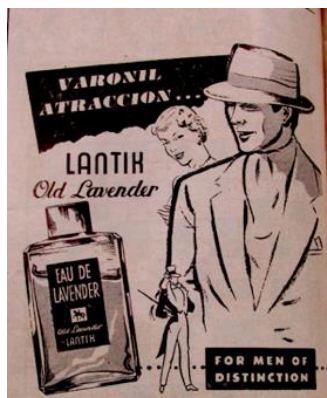
Figura 7. Lantik: Old Lavender. (1955). Revista Cromos, 80(1985), p. 62.