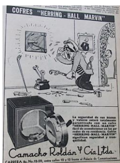
Figura 30, Herring. (1951). Revista Cromos, LXXI(1789), p. 35.

Sin embargo, el Hombre Moderno de éxito no era el que estudiaba para ser técnico, sino el que empleaba a éste en su empresa o industria, y aquel que estaba vinculado con la política del país. A este empresario, industrial y político recurrió la publicidad para venderle productos de consumo apelando a sus cualidades de liderazgo, seguridad en sí mismo y poder. La mayoría de estos productos estaban relacionados con el lujo, la comodidad, la tecnología, los bienes privados, las diferencias entre la clase social (alta) y las demás, la imitación de culturas como la norteamericana, la inglesa y la francesa; todo esto para validar la posición social, la capacidad económica y, por tanto, el poder: