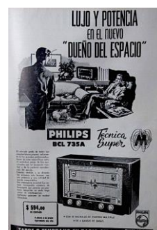
Figura 32. Philips BCL 735 A. (1955). Revista Cromos, 80(1973), p. 2