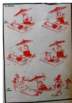
Figura 36. Plácido. (1953). Revista Cromos , LXXV(1871), p. 13.

Era común que este hombre se considerara completo o satisfecho sólo mediante dos mujeres: la esposa y las otras: