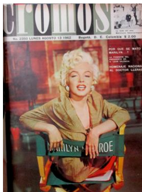
Figura 54. Por qué se mató Marilyn. (1962). Revista Cromos , 91(2350), p. 1.

La ausencia de Marilyn llevó a que la actriz francesa Brigitte Bardot ocupara el lugar de la mujer más bella en el cine, encarnando el deseo del Hombre Moderno. Bardot contó con cualidades parecidas a las de Marilyn Monroe, inspiró delicadeza e inocencia, no obstante, se distinguió por su seducción, erotismo, rebeldía y libertad, éstas la llevaron a convertirse en un símbolo sexual; además, con frecuencia apareció desnuda en las pantallas del cine y esto atrajo decididamente la atención del hombre sobre ella, su cuerpo en la pantalla se convirtió en algo valioso (Dalmau, 2009).