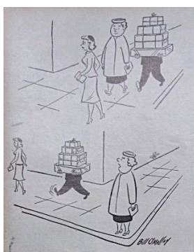
Figura 35. O'Malley, Bill. (1955). Revista Cromos , 80(1995), p. 52.