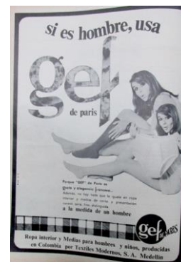
Figura 49. Gef de Paris. (1968). Revista Cromos , 125(2665), p. 16.

El cuerpo bello continuó siendo un modelo a seguir para los hombres modernos colombianos y los galanes del cine norteamericano e inglés, que aparecieron en Cromos , eran el referente de belleza de los lectores de la revista: