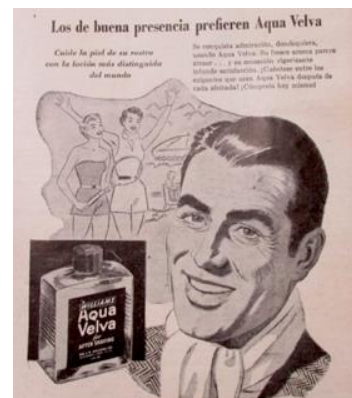
Figura 8. Aqua Velva. (1956). Revista Cromos, 82(2032), p. 51.