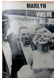
Figura 25. Marilyn. Vuelve la Nº 1. (1959). Revista Cromos , 88(2184), p. 47.

Contrario al cuerpo bello del Hombre Moderno, estuvo el cuerpo feo (descuidado, desproporcionado, desarreglado, flácido y desfigurado) y el cuerpo enfermo (decadente, cansado y adolorido). Estos se identificaron en los anuncios publicitarios, en las caricaturas, en los artículos de la sección del Cine y Espectáculo y en algunas columnas dirigidas a la mujer. El hombre feo, en la década del cincuenta, puede describirse como gordo, calvo o