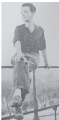
Figura 65. El hombre que se volvió mujer. (1962). Revista Cromos , 91(2352), p. 17.