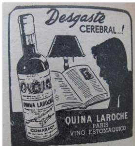
Figura 28. Quina Laroche. Paris. Vino estomacal. (1950). Revista Cromos, LXIX(1724), p. 16

El hombre enfermo se caracterizó por la falta de energía que se reflejó en el cansancio y el dolor. En la revista aparecieron diferentes productos para el cansancio y para mejorar la salud, adecuados para el Hombre Moderno que requería la energía para mantenerse en pleno proyecto modernizador, donde la economía, la política y la sociedad necesitaban sujetos productivos, activos y saludables: