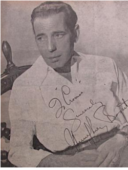
Figura 21. Carrera, Dianne. (1950). Así es Humphrey Bogart. Revista Cromos , LXIX(1714), p.10.