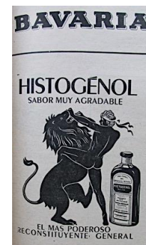
Figura 29. Histogénol. (1953). Revista Cromos, LXXV(1887), p. 41

El estado físico del hombre era el reflejo de su moral: el hombre bello era limpio, atractivo, fuerte y honorable; el hombre feo era sucio, desarreglado y sin mayores virtudes; el hombre sano era poderoso, productivo, distinguido y atractivo; el hombre enfermo era débil, de aspecto cansado y, en ocasiones, ofensivo.