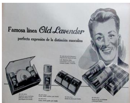
Figura 45. Old Lavender. (1960). Revista Cromos , 90(2264), p. 49.

El Hombre Moderno, ahora Ejecutivo, continuó preocupándose por una apariencia física bella, ya que ésta dio cuenta de sus virtudes y le permitió presentarse como un hombre integral, con un cuerpo en forma, limpio y elegante. Esta apariencia continuó reflejándose en la preocupación por el cabello (usarlo corto y bien peinado), la vestimenta (usar el traje adecuado) y la higiene; seguían siendo frecuentes los anuncios publicitarios de productos de aseo personal como fijadores, cremas y máquinas de afeitar, colonias, jabones, etc.: