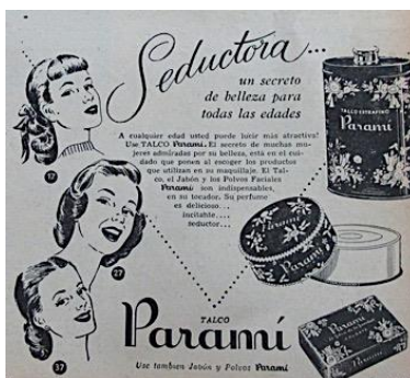
Figura 9. Paramí. (1951). Revista Cromos, LXXI(1765), p. 39.

Los anuncios publicitarios para el consumo femenino plantearon una dependencia a la mirada masculina para validar la importancia de la belleza, así, la mujer bella era la atractiva, seductora, cautivadora, encantadora, femenina, incitante y otras cualidades que debían llamar la atención del hombre viril.