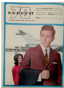
Figura 47. Everfit 70. (1967). Revista Cromos , 120(2592), p. 5.

En los anuncios publicitarios de la revista continuaron identificándose marcas de ropa de Inglaterra, Francia y Estados Unidos, sin embargo, la mayoría eran marcas nacionales que usaban nombres extranjeros como Everfit y Gef que ofrecían diferentes piezas de vestuario caracterizadas por la influencia de la moda europea y norteamericana. Estos anuncios continuaron acudiendo a la presencia varonil del hombre como estrategia para el consumo: