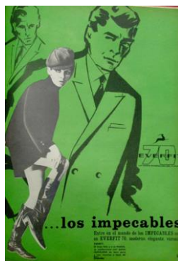
Figura 48. Everfit 70. (1968). Revista Cromos , 124(2648), p. 43.