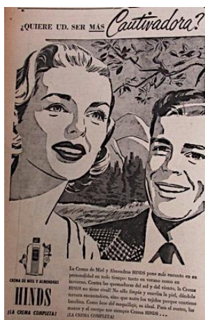
Figura 10. Hinds. (1951). Revista Cromos, LXXI(1765), p. 46.