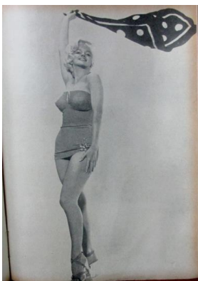
Figura 53. Marilyn sigue en primera fila. (1961). Revista Cromos , 90(2294), p. 7.

El ideal del cuerpo bello masculino, que se vio reflejado en los galanes del cine, tuvo su equivalente femenino en Marilyn Monroe, como la mujer más bella y deseada por el Hombre Moderno de la década del cincuenta, y su muerte, en 1962, la convirtió en uno de los mayores iconos de la belleza femenina para la cultura moderna (Hobsbawm, 2013).