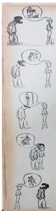
Figura 19. Cuando el hombre se arregla. (1959). Revista Cromos , 88(2186), p. 5.

El cabello era un aspecto físico significativo que representaba limpieza y civilidad, ya que se llevaba corto para resaltar el rostro sano; el cabello largo era símbolo de rebeldía y barbarie (Pedraza, 1999). El cabello corto también representó la masculinidad: 1. Al diferenciar al hombre de la mujer: hombre de cabello corto y mujer de cabello largo, la mujer con el cabello corto era una mujer que debía distinguirse por sus rasgos delicados y su comportamiento femenino, de lo contrario era una Extraña (poco femenina o lesbiana). 2. Al dar cuenta de la edad viril del hombre: los hombres jóvenes y adultos tenían pelo, tanto en la cabeza como en otras partes del cuerpo: “el hombre de pelo en pecho implica, en la jerga popular, atributo de gran varonilidad” (Revista Cromos, LXXIV(1854), 1952, p. 7). Aunque la calvicie se relacionó con los altos niveles de las hormonas sexuales masculinas, el hombre calvo era considerado como un hombre que envejecía, se distinguía de los otros hombres, más jóvenes, por su veteranía y su dominio, pero su falta de cabello era una muestra de la disminución de sus apetitos sexuales (Morris, 2009). De ahí que en los anuncios publicitarios de la revista, dirigidos al hombre, escasas veces apareciera el hombre calvo, cuando aparecía era para referir a un hombre mayor o, en las caricaturas, para exponerlo como un hombre débil, pasivo o decadente.