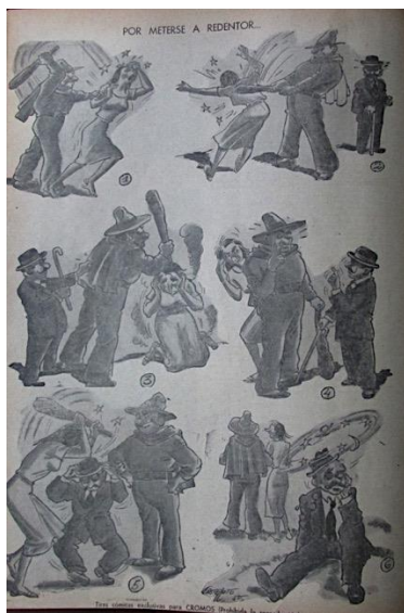
Figura 38. Por meterse a redentor... (1950). Revista Cromos , LXIX(1744), p. 47.

El hombre que ostentó la hegemonía y el dominio sobre la mujer como esposo, sobre los hijos como padre y sobre la familia como proveedor era considerado machista. Se relacionó con los otros desde una posición superior, generalmente imponiendo su poder de forma autoritaria y violenta. La Revista Cromos lo presentó como un opuesto del Hombre Moderno, ya que estas conductas no se consideraron propias de un caballero. El machista era referido como el hombre de una clase social baja, es decir, el obrero y el campesino, incivilizados, pobres e ignorantes, descripción que corresponde a la dada por Montesinos (2002) en el primer capítulo.