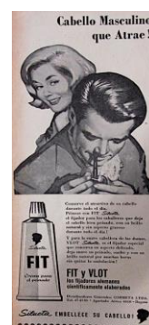
Figura 18. FIT y VLOT. (1959). Revista Cromos , 88(2210), p. 8.