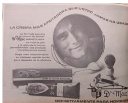
Figura 46. D' Mac. (1968). Revista Cromos , 124(2646), p. 58.