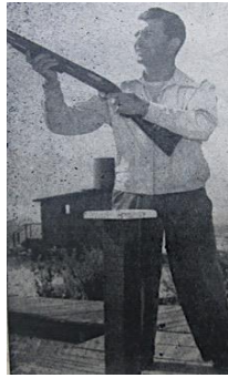
Figura 22. Robert Taylor. (1950). Revista Cromos , LXIX(1716), p. 10.