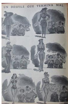
Figura 34. Un desfile que termina mal. (1950). Revista Cromos , LXIX(1742), p.1.

En la revista, el Hombre Moderno también era representado como aquel que contaba con una esposa que le ayudaba a llevar a cabo su rol social de hombre honorable y caballero, pero era también el hombre viril que deseaba a otras mujeres aparte de su esposa.