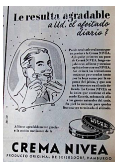
Figura 16. Crema Nivea. (1954). Revista Cromos , 79(1954). p. 5.

El Hombre Moderno era el hombre civilizado reconocido por el buen olor y la limpieza: el hombre que expelía malos olores era catalogado como perturbador y amenazante de la integridad física, la suciedad era vista como una afrenta a la integridad moral. Estas razones llevaron a que en la modernidad se aumentara el uso del agua, colonias, cremas dentales y desodorantes garantizando la frescura, los buenos olores y la belleza (Pedraza, 1999). Era un sujeto preocupado por tener una buena, elegante y distinguida apariencia y ésta, que partió de la higiene, se materializó en el cuidado del cabello. El cabello se usaba corto, hacía un lado y fijado con crema; el rostro sin barba, sólo se usó bigote como posibilidad de dar cierta distinción.