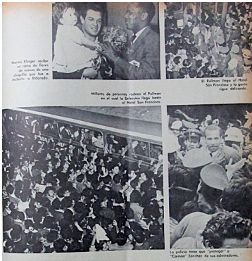
Figura 41. Homenaje de héroes para el seleccionado. (1962). Revista Cromos , 91(2342), p. 25.