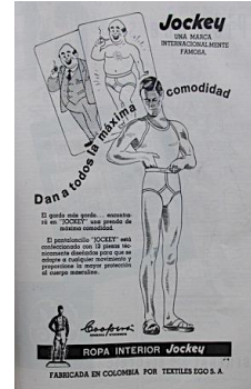
Figura 27. Jockey. Revista Cromos. (1953). LXXV(1907), p. 5.

El hombre enfermo se caracterizó por la falta de energía que se reflejó en el cansancio y el dolor. En la revista aparecieron diferentes productos para el cansancio y para mejorar la salud, adecuados para el Hombre Moderno que requería la energía para mantenerse en pleno proyecto modernizador, donde la economía, la política y la sociedad necesitaban sujetos productivos, activos y saludables: