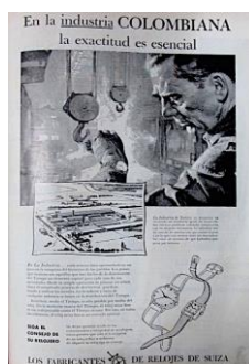
Figura 31. Reloj Suizo. (1954). Revista Cromos, 78(1940), p. 9.