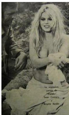
Figura 55. Brigitte Bardot. (1969). Revista Cromos , 127(2802), p. 6

La ausencia de Marilyn llevó a que la actriz francesa Brigitte Bardot ocupara el lugar de la mujer más bella en el cine, encarnando el deseo del Hombre Moderno. Bardot contó con cualidades parecidas a las de Marilyn Monroe, inspiró delicadeza e inocencia, no obstante, se distinguió por su seducción, erotismo, rebeldía y libertad, éstas la llevaron a convertirse en un símbolo sexual; además, con frecuencia apareció desnuda en las pantallas del cine y esto atrajo decididamente la atención del hombre sobre ella, su cuerpo en la pantalla se convirtió en algo valioso (Dalmau, 2009).