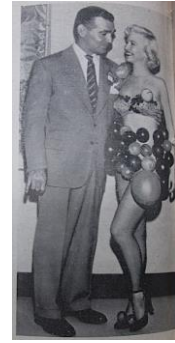
Figura 23. Clark Gable. (1950). Revista Cromos , LXIX(1719), p. 24.

La belleza femenina del mundo de Hollywood que el hombre moderno deseó, ya que si había un galán a quien emular, debía haber una mujer para ese galán a quien codiciar, la representó Marilyn Monroe. Esta actriz tuvo la mayor cantidad de portadas y artículos, sobre mujeres del mundo del cine, rastreados en la revista Cromos (42), superando a otras actrices como Ingrid Bergman, Elizabeth Taylor, Sofía Loren, etc., que también eran centro de atención. En ella se resaltaron cualidades como la delicadeza, la inocencia, la insuperable belleza y la seducción: