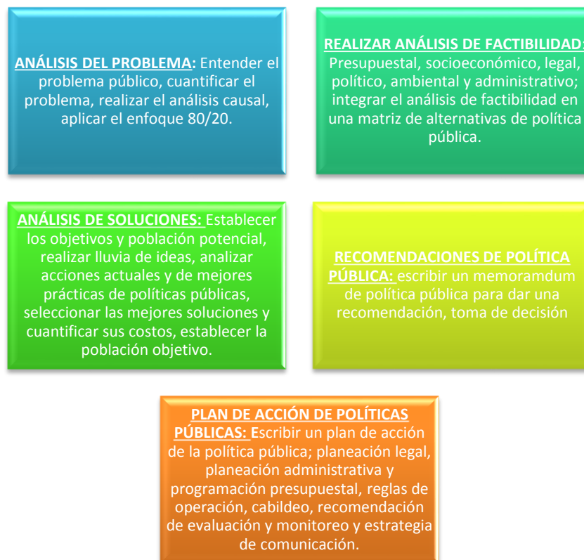
Imagen 1: Fases de análisis de las políticas públicas.

de ser consideradas en los diseños de políticas públicas. De estas categorías se estudiarán tres que se convierten en el marco analítico que permitirá, a través de la recolección de datos empíricos, conocer el estado del diseño de la misma. Las categorías presentadas por el autor son: análisis del problema, análisis de factibilidad, análisis de soluciones, recomendaciones de política pública, y plan de acción de políticas públicas (ver Imagen 1).