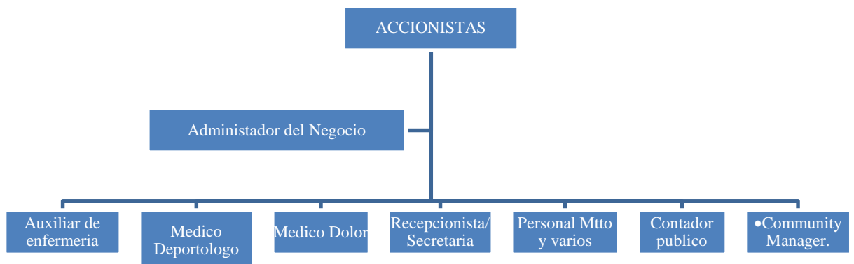
Figura 3. Organigrama