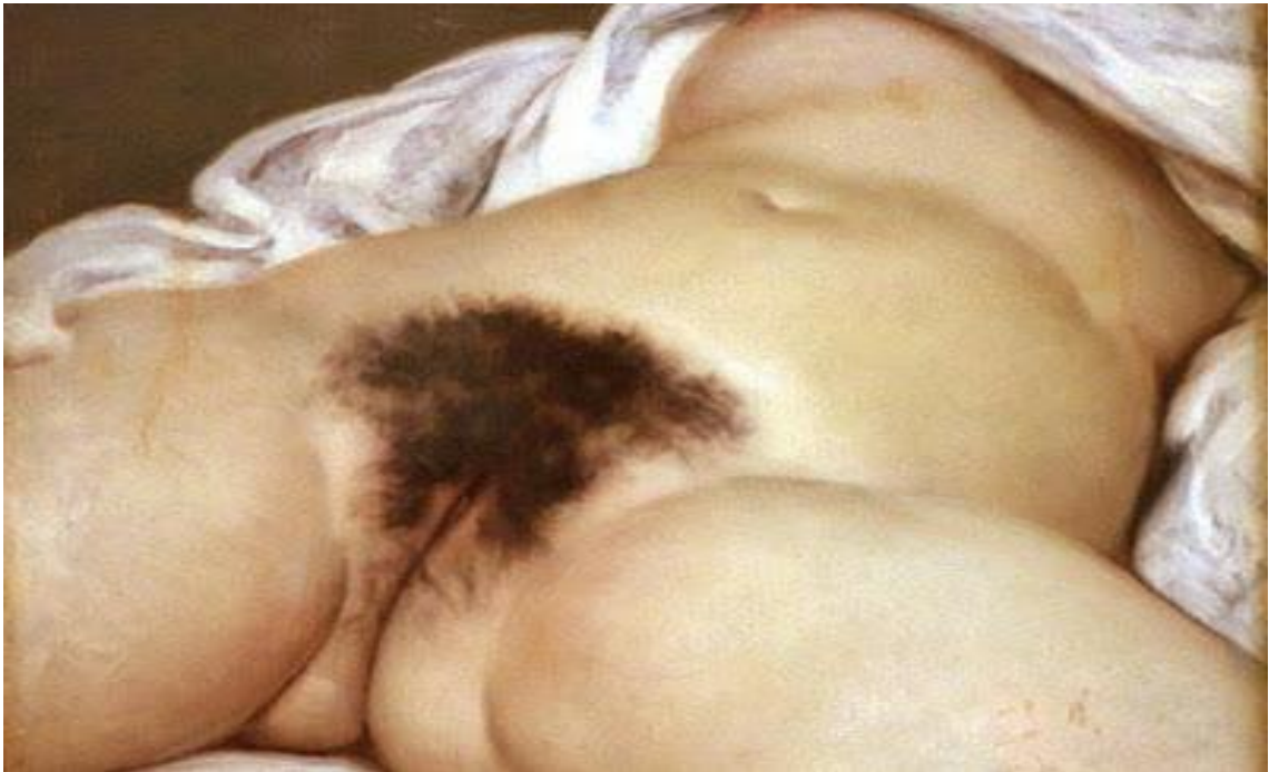
L'origine du monde (1866) Gustave Courbet

Doña Lucrecia de tanto en tanto se movía en cámara lenta, con el abandono de quien se cree a salvo de miradas indiscretas, y mostraba al respetuoso Modesto, clavada a dos pasos del lecho, sus flancos y su espalda, su trasero y sus pechos...Por fin, fue abriendo las piernas, revelando el interior de sus muslos y la medialuna de sus sexo. “En la postura de la anónima modelo de L’origine du monde, de Gustave Coubert (1866), buscó y encontró don Rigoberto, transido de emoción...” (Vargas, 1997: 61)