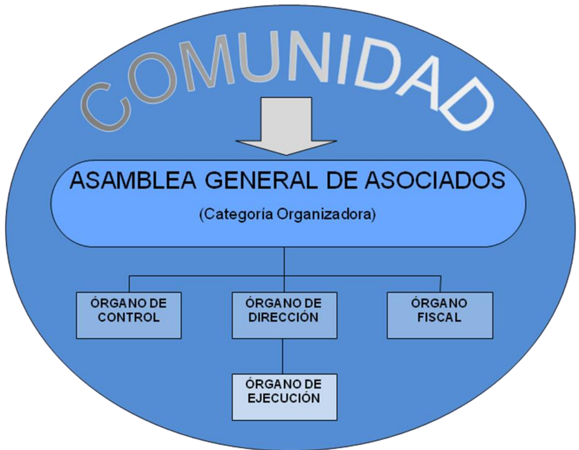
Figura 3. Organigrama de la estructura administrativa de las organizaciones empresariales de carácter solidario.

Este trabajo amplía, a continuación, algunas reflexiones propias, en lo referido a las ya citadas instancias de decisión, esto es, aquellas estructuras relacionadas de modo directo con la operación del factor combinador o Factor Gestión.