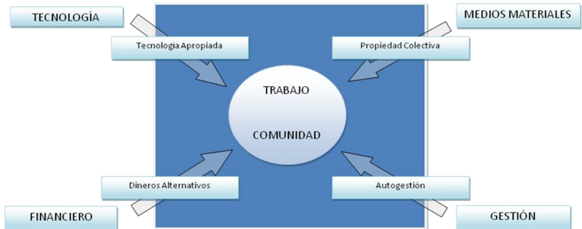
Figura 2. Relación de “recomposición social del trabajo”

En esta concepción, la situación general de los factores Laboral y C se muestra menos deprimida que en el caso anterior, a la par que la posición y el tamaño propio de los factores Tecnología, Medios Materiales, Financiamiento y Gestión se muestra un poco más proporcionado. Así las cosas, en este esquema las flechas transitan en sentido inverso, y los factores Laboral y C aparecen menos expropiados en sus capacidades. La extrema especialización que se presenta hoy en el factor Tecnología pasa a ser así una tecnología apropiada socialmente por los factores Laboral y C; del camino de la exclusiva propiedad privada se hace el tránsito a un tipo de propiedad que también puede ser colectivo (no necesariamente público); el factor Financiamiento se diversifica en moneda alternativa y aparecen nuevas o se recuperan antiguas modalidades de objetivar la confianza (trueque, moneda social, intercambio directo), y el reservado y burocratizado factor Gestión presenta una atomización benéfica bajo la forma de la autogestión , acaso un ejemplo real de democratización del poder.